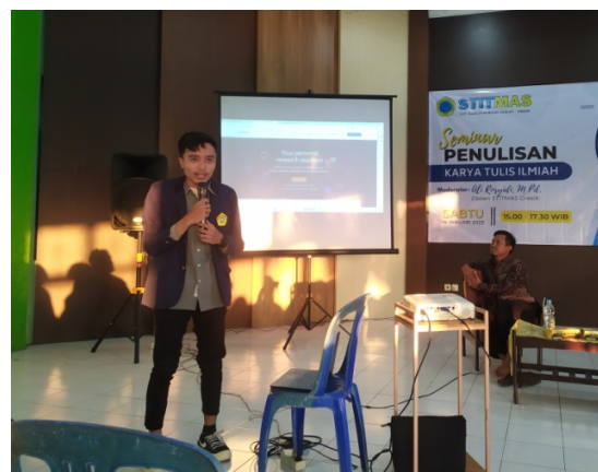
Gambar 2. Dokumentasi Sesi Penyampaian Materi

Di tengah sesi penyampaian materi, pengabdian mengajak partisipasi peserta dengan cara melakukan simulasi menulis. Simulasi yang dirancang agar semua mahasiswa peserta dapat mengenalkan dirinya secara tertulis. Tahapan pertama pada sesi ini pengabdian memperkenalkan outline tulisan perkenalan mahasiswa peserta, meliputi nama lengkap, program studi, alamat, serta hobi. Tahapan kedua, penulis memperkenalkan akses penggunaan Padlet. Seluruh peserta membawa smartphone yang berisikan paket data, sehingga dimanfaatkan dalam sesi ini untuk berinteraksi menulis. Pengabdian menunjukkan akses dan cara menulis menggunakan Padlet menggunakan Smartphone.