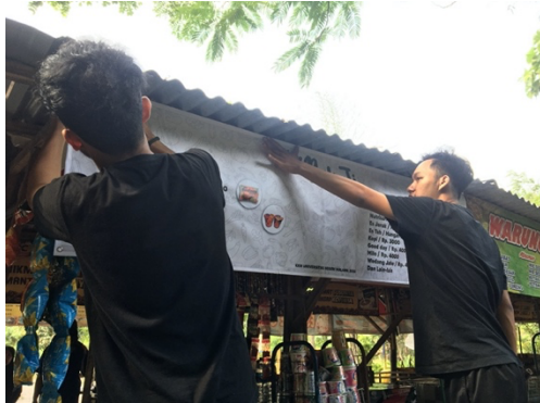
Gambar 4. Kegiatan Pemasangan Banner

Pada hari ketiga, dilakukannya dalam metode praktik lapangan yaitu pemasangan banner dan pengenalan aplikasi pembayaran secara non tunai. Antusias para pelaku usaha dalam pemasangan banner sangat terlihat dan turut membantu tim Kerja Kuliah Nyata (KKN) Universitas Negeri Malang dalam pemasangan banner dan memberi dukungan dengan kesediaan banner di pasang dan memperindah usaha mereka.