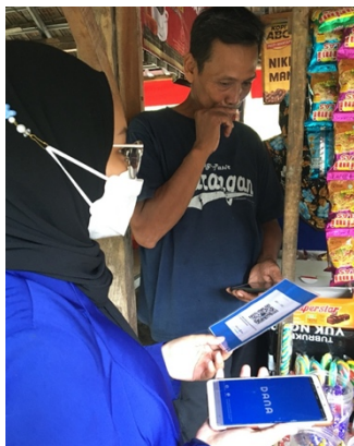
Gambar 5. Kegiatan Pengenalan Pembayaran non tunai

Pada pengajaran dan pengenalan mengenai aplikasi DANA dimana jumlah para pelaku usaha yang berhasil diterapkan hanya satu outlet dari 12 outlet dan 9 yang masih aktif berjualan.