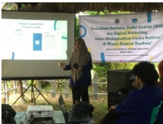
Gambar 2. Kegiatan Sosialisasi Business Model Canvas

Dalam kegiatan sosialisasi ini dilakukan di ruangan terbuka. Selama pemberian materi dengan metode pemaparan yang dilakukan sekitar 20 menit pemaparan BMC.