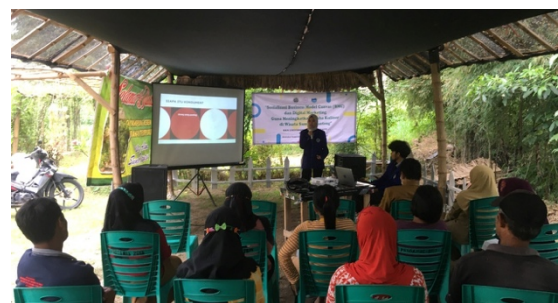
Gambar 3. Kegiatan Sosialisasi dan tutorial Digital Marketing

Pada metode tutorial pada materi Digital Marketing dilakukan selama 10 menit, dan 10 menit pemaparan materi kemudian diikuti dengan 10 menit diskusi yang berisi berbagi pengalaman dan penyampaian akan dilakukan pemasangan banner demi menunjang fasilitas dan pengenalan secara langsung dalam alat pembayaran non tunai atas keberlanjutan dari kegiatan sosialisasi.