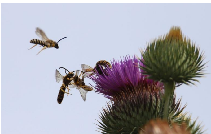
Ryc. 2. Samce i samica smuklika szerokopasego, Górzycza, 29 VI 2022.