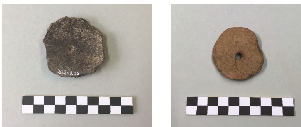
Figur 4. En for perioden klassisk tenvægt i fragmenteret stand fra Nr. Hedegård i Nordjylland samt et forarbejde fra Kærbølling i Sønderjylland. Præfabrikater udgør en stor del af empirien.

publikationen om den nordjyske byhøj Nørre Hedegård. Her er identiske skår beskrevet under betegnelsen justervægte, da der henvises til publikationen om Vendehøj (Haue 2009, 143). Begge lokaliteter har vi registreret materiale fra og mener, at materialet skal tolkes som tenvægte. Denne uklarhed om funktion er en problematik, da den bunder i definitionen af den perfekte tenvægt. En sådan skal være jævn, symmetrisk og have en lige eller konisk gennemboring, som er centralt placeret (Liu 1978, 97; Barber 1991, 52; Firth 2015, 155; Strand & Nosch 2015, 356f). Genbrugskeramikskårene fra ældre jernalder er imidlertid ofte ujævnt afrundet, gennemboringen er dobbeltkonisk, symmetrien er ikke udtalt og hullet kan være decentralt placeret. Figur 4. Umiddelbart vil konklusionen være at forkaste dem som spinderedskaber på et teoretisk grundlag (Rahmstorf et al. 2015, 271; Strand & Nosch 2015, 359).