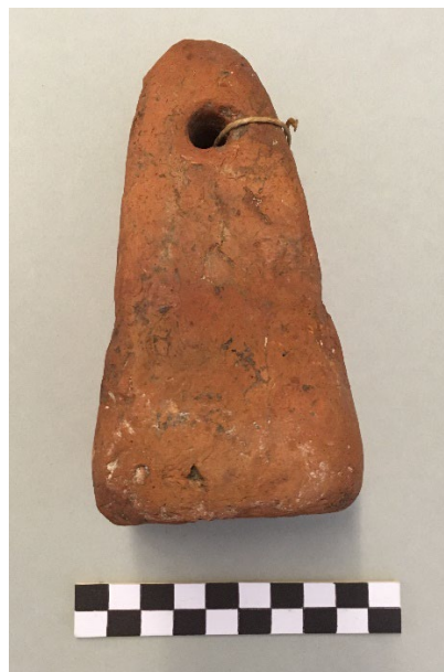
Figur 2. En pyramideformet vævevægt fra bopladsen Ginderup i Nordjylland. Denne vævevægtstype trækker tråde sydpå, hvor sådanne vævevægte ofte anvendes.

På baggrund af empirien kan vi konkludere, at den foretrukne vævevægtstype er den pyramideformede. Derudover optræder skive- og torusformede eksemplarer. Det må imidlertid konstateres, at vævevægtene repræsenterer en tekstilfremstillingsmetode, som kun optræder i yderst begrænset omfang. At der i en periode på 700 år i så stort et område forekommer så få vævevægte, er bemærkelsesværdigt. Tekstilernes udsagn om rundvævning underbygges dermed også af fraværet af større mængder vævevægte. Produkt og produktion er i balance. Det er og bliver en vægtløs tid. Med få undtagelser, som vidner om lokale præferencer i kortere tidsrum – sandsynligvis inspireret og indført af folk fra steder som de romerske provinser. Figur 2. At tekstilviden flyder mellem sydligere kulturer og Jylland, understøttes endvidere af den foretrukne tenvægtstype.