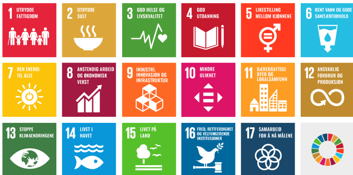
Figur 1 FNs bærekraftsmål

FNs bærekraftsmål består av 17 mål og 169 delmål. Hensikten med målene er å fungere som en felles global retning for land, næringsliv og sivilsamfunn. Et grunnprinsipp for bærekraftsmålene er at ingen skal utelates. Målene legger derfor spesiell vekt på sårbare mennesker som flyktninger og minoriteter (FN, 2023). Hvert enkelt bærekraftsmål har et eget fokusområde, f.eks. mindre ulikhet, utrydde fattigdom og livet i havet. Bærekraftsmålene vises i figur 1.