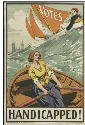
Plakat 2: Stemmeretten blir sett på som et seil, og er symbol på at man lettere kommer seg frem med hjelp av den.