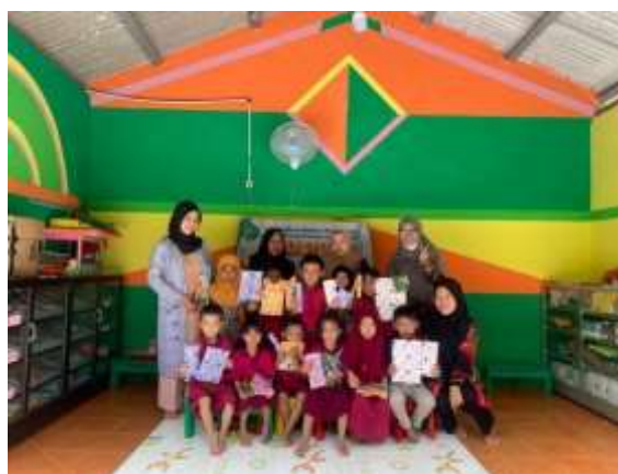
Gambar 2. Tim Pengabdian Foto Bersama Guru-guru dan Siswa-siswi Paud Azizah