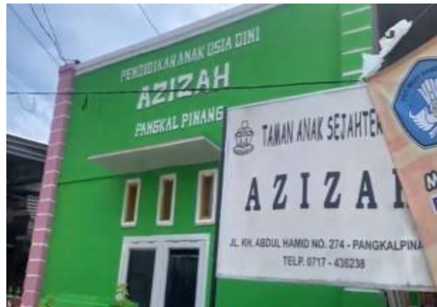
Gambar 1. Paud Azizah Kota Pangkalpinang HASIL DAN PEMBAHASAN