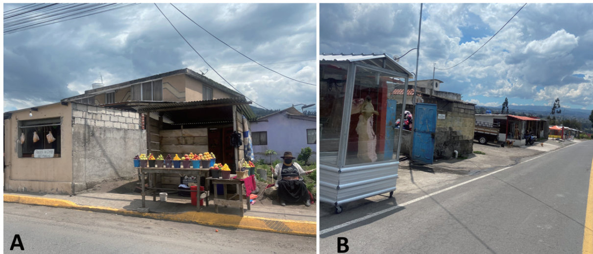
A. Plazas improvisadas.