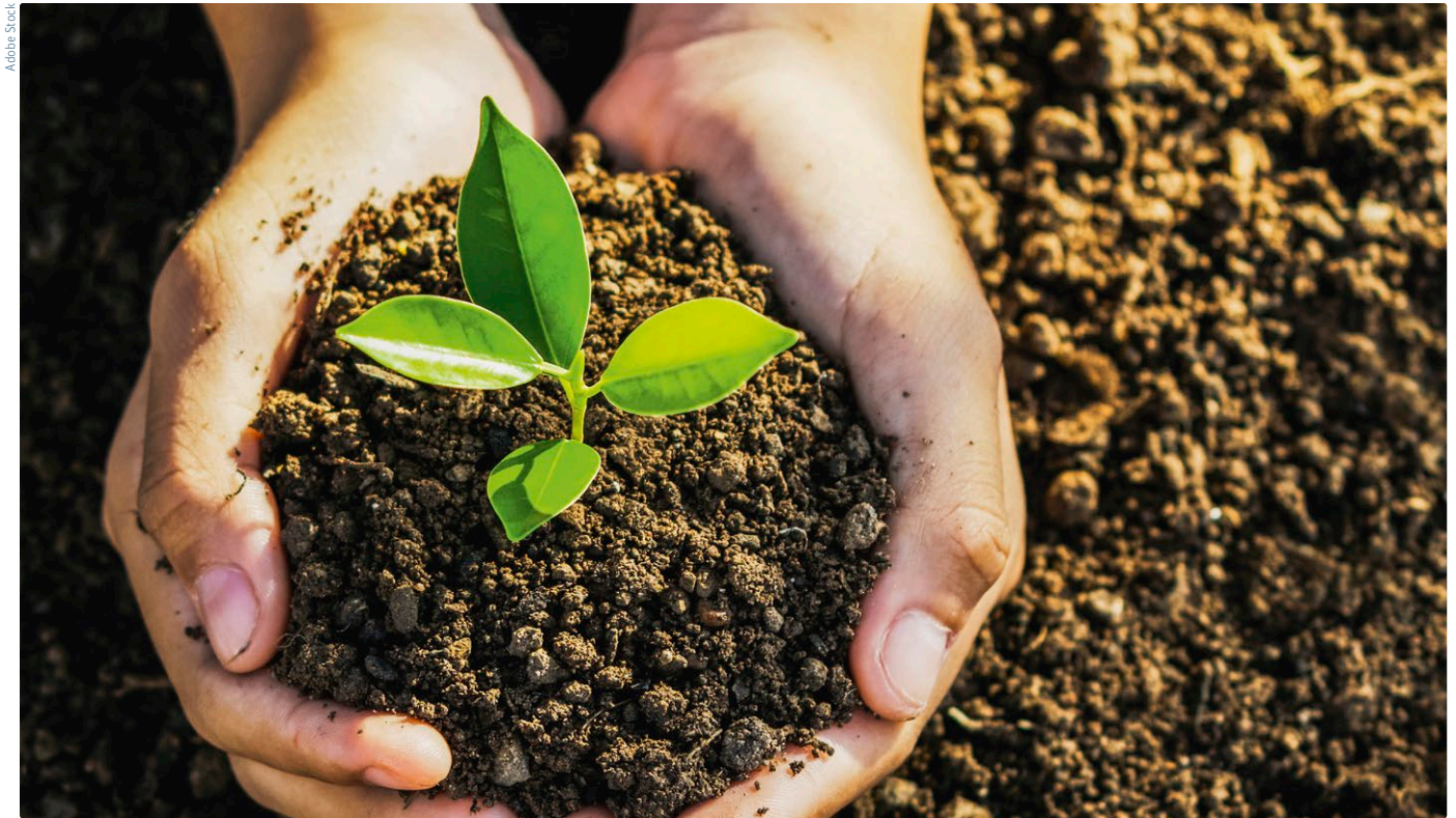
Gesunde Böden sind die Basis blühender Gärten, fruchtbarer Äcker und einer kühlenden Pflanzendecke. Les sols sains sont à la base des jardins en fleurs, des champs fertiles et d'une couverture végétale rafraîchissante.

lebenswerte Siedlungen. Sie nehmen Wasser auf und mindern dadurch das Überschwemmungsrisiko. Bei trockenem Wetter verdunstet dann das Wasser wieder, so tragen die Böden zu einem angenehmen Klima bei. Für die Versorgung mit Nahrungsmitteln sind die Menschen in den Siedlungen auf leistungsfähige Böden im Umland angewiesen, die der Landwirtschaft langfristig gute Erträge sichern. Die Siedlungsentwicklung nach innen hilft, das notwendige Kulturland zu schonen. Eine sorgfältige und umsichtige Planung bietet Chancen, die Böden und ihre vielfältigen Funktionen zu erhalten und zu stärken. Ziel ist, die Siedlungen klimagerecht zu gestalten, die Biodiversität zu fördern und insgesamt hohe Lebensqualität zu erreichen.