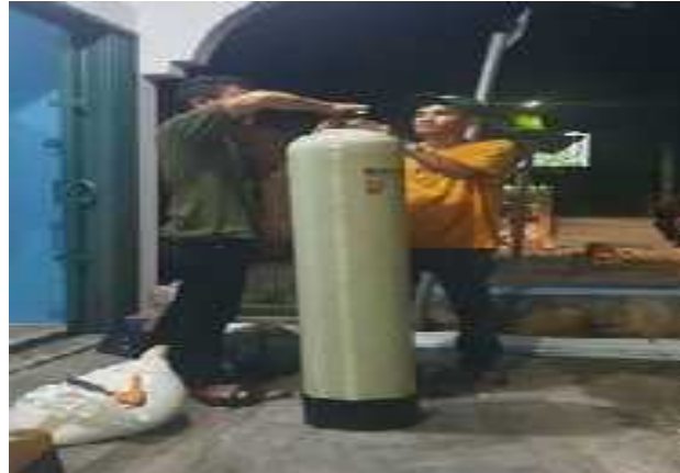
Gambar 7. Pengisian Komposisi Pada Tabung Media

Gambar 8 memperlihatkan pemasangan Reverse Osmosis (RO). Sistem pengolahan air minum ini memanfaatkan teknologi Reverse Osmosis (RO) tipe 2000 GDP yaitu teknologi pemurnian air yang paling mutakhir saat ini (Irwanto et al., 2023). Reverse Osmosis (RO) menyaring air dari tingkatan yang paling kecil yaitu 1/10.000 mikron. Dengan sangat kecil membran dari RO sehingga menghasilkan air yang sangat murni (Safentry et al., 2020; Sisnayati et al., 2023).