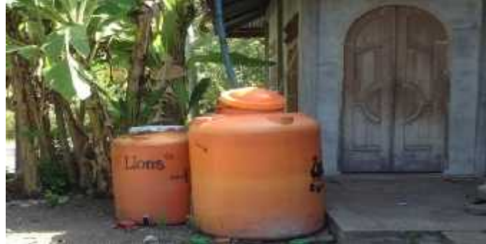
Gambar 2. Tempat Penampungan Air Hujan

sangat luas seperti peluang untuk memasarkan air layak konsumsi secara digitalisasi pemesanan air minum isi ulang (Insani et al 2022).