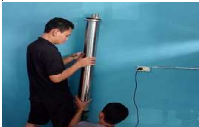
Gambar 8. Proses Pemasangan RO 2000 GDP.

Gambar 8 memperlihatkan pemasangan Reverse Osmosis (RO). Sistem pengolahan air minum ini memanfaatkan teknologi Reverse Osmosis (RO) tipe 2000 GDP yaitu teknologi pemurnian air yang paling mutakhir saat ini (Irwanto et al., 2023). Reverse Osmosis (RO) menyaring air dari tingkatan yang paling kecil yaitu 1/10.000 mikron. Dengan sangat kecil membran dari RO sehingga menghasilkan air yang sangat murni (Safentry et al., 2020; Sisnayati et al., 2023).