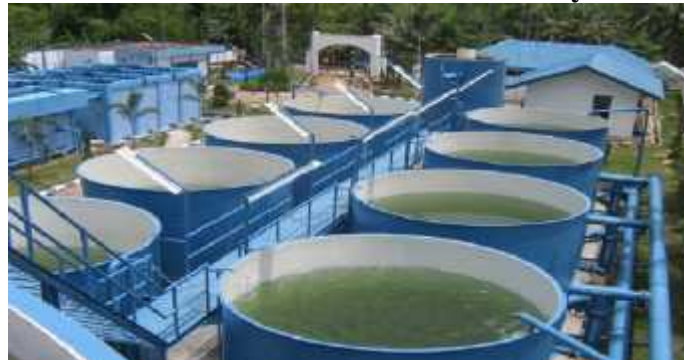
Gambar 4. Air PDAM Kabupaten Bengkalis