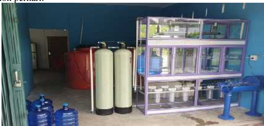
Gambar 6. Hasil Pemasangan Depot Air Isi Ulang

Perakitan komponen depot air dibantu oleh 2 orang mahasiswa Jurusan Teknik Elektro. Alat yang dirakit dimulai dari penyiapan tabung FRP sebagai alat filtrasi dengan diisi media berupa pasir zeolit, silika dan karbon aktif (Gusnarto et al., 2022; Marlianda et al., 2021; Purboyo et al., 2023). Tabung filtrasi yang digunakan sebanyak 2 unit. Instalasi pengolahan air minum dirakit dengan sumber baku dari PDAM yang terdiri dari beberapa bagian utama yaitu pompa air, kran pembagi, tabung filtrasi FRP, RO, lemari, dan lampu ultraviolet. Mitra dalam kegiatan adalah anggota dari BUM Desa Unggul Sari sebanyak 7 orang. Peserta sangat berperan aktif dalam mengikuti kegiatan ini baik dari pemasangan komponen depot air sampai pelatihan pengoperasian depot air minum. Gambar 6 memperlihatkan hasil pemasangan peralatan untuk depot isi ulang air minum. Pada saat ini produksi air minum hanya 65 galon perhari.