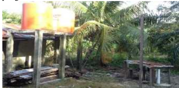
Gambar 3. Sumber Air Sumur Bor Masyarakat

Peraturan Menteri Kesehatan No. 416/MENKES/PER/IX/1990 mengenai persyaratan dan pengawasan kualitas air (Lianda et al., 2022) telah menjelaskan persyaratan kesehatan tentang air bersih. Dalam rangka memenuhi kebutuhan air bagi masyarakat diperkuat lagi dengan Undang-undang Kesehatan No. 23 tahun 1992 Ayat 3 tentang air minum yang dikonsumsi oleh masyarakat harus mengikuti syarat-syarat kuantitas dan kualitas. Air yang berasal dari sumur bor mengandung zat besi dalam berbentuk ferro ( Fe^{2+} ). Air tanah dikeluarkan dari dalam tanah dengan pompa listrik lalu beroksidasi dengan oksigen ( O_2 ) maka besi ( Fe^{2+} ) akan teroksidasi menjadi ferihidroksida ( Fe(OH)_3 ) (Amri et al., 2018). Ferihidroksida berwarna kuning kecoklatan dan bisa mengendap. Hal ini menyebabkan cucian dan peralatan porselin menjadi kuning. Apalagi digunakan untuk minum dan memasak yang bisa berbahaya buat kesehatan. Tingkat kadar ion besi Fe ( Fe^{2+} atau Fe^{3+} ) yang tinggi dapat dilihat dari warna kuning kecoklatan jika air tersebut yang telah disimpan beberapa menit di dalam bak penampungan.