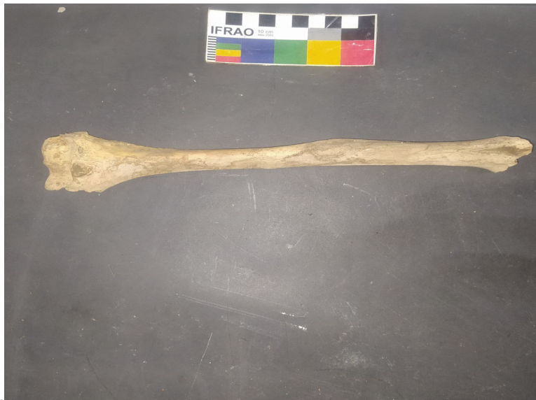
FIGURA 9: FÊMUR DIREITO DE UM INDIVÍDUO JOVEM