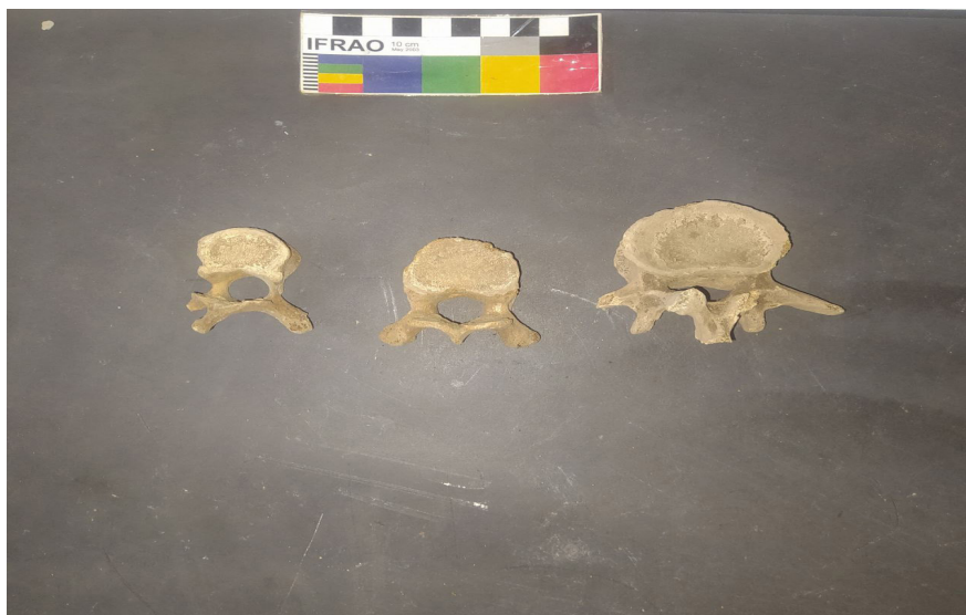
FIGURA 10: VERTEBRAS TORÁCICAS.