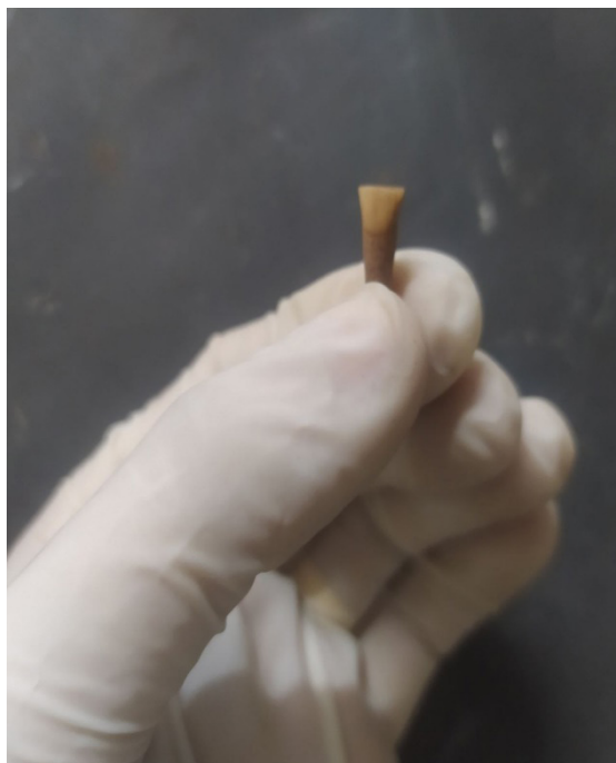
FIGURA 6: NORMA LABIAL EXIBINDO DESGASTE SEVERO.