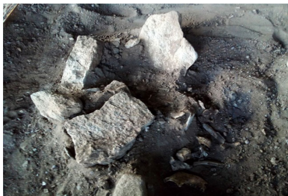
FIGURA 5: FOGUEIRA UTILIZADA NO RITUAL DE SEPULTAMENTO CARIRI.