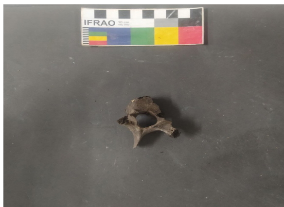
FIGURA 11: VERTEBRA QUE RECEBEU AQUECIMENTO.