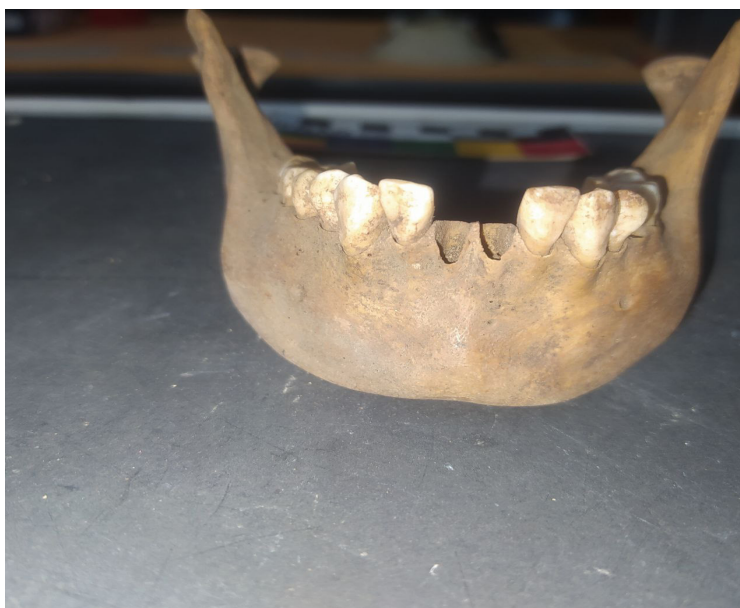
FIGURA 8: DENTE COM DESGASTE INCLINADO BUCALMENTE.