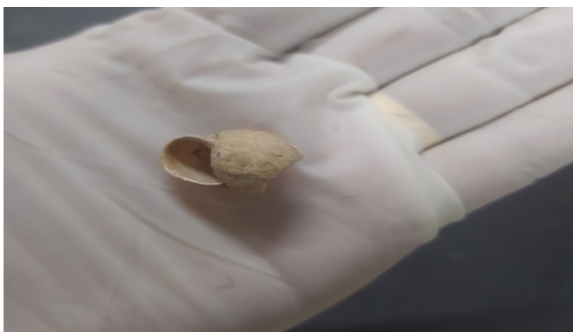
FIGURA 12: CONCHA RECOLHIDA DURANTE A ESCAVAÇÃO.