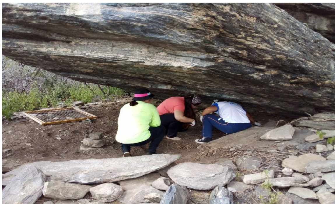
FIGURA 4: ABRIGO ROCHOSO ONDE ESTÁ LOCALIZADO O SÍTIO SERROTE DOS OSSOS.