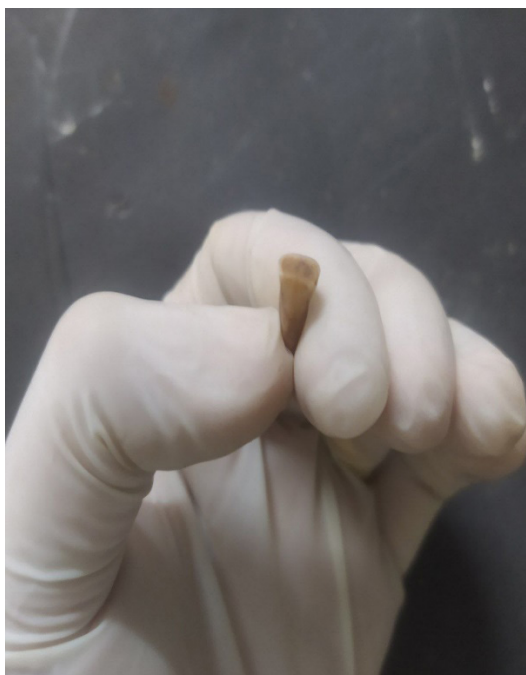
FIGURA 7: NORMA LINGUAL EXIBINDO DESGASTE SEVERO.