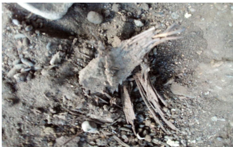
FIGURA 3: TRANÇADO DE CAROÁ ENCONTRADO NA ESCAVAÇÃO NO SÍTIO SERROTE DOS OSSOS.