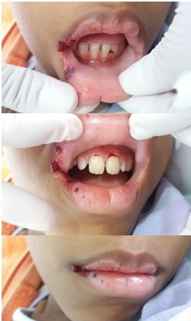
Figura 1. Aspecto clínico na avaliação inicial, lesão crostosa hemorrágica em ambos os lábios.

prévia de hemoculturas, fator estimulador de colônias de granulócitos, Fluconazol, Filgrastima, hidratação e suporte nutricional. As hemoculturas foram negativas.