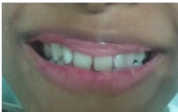
Figura 3. Aspecto clínico após 15 dias da instituição dos cuidados odontológicos, mostrando recuperação total do tecido labial.

Após sete dias, houve remissão total da lesão e restabelecimento físico e emocional da paciente. Não houve recidiva da mucosite oral (Figura 3). Neste caso, a paciente foi diagnosticada com Neuroblastoma metastático, aos nove anos, com amplificação de NMYC, após cinco meses da recidiva, e treze meses após o diagnóstico, a paciente veio a óbito, devido à gravidade do caso, a despeito da terapia oncológica para o alto risco instituída.