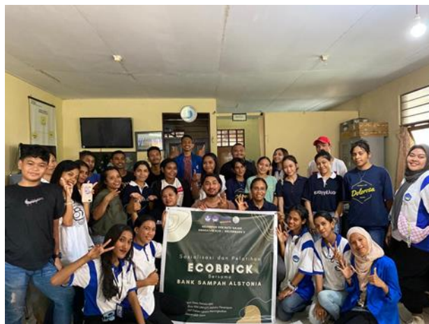
Gambar 4. Pelaksanaan Program Sosialisasi dan Pelatihan Ecobrick oleh Bank Sampah Alstonia bersama Pemuda-Pemudi di Kelurahan Batu Gajah dan Mahasiswa KKN Unpatti Angkatan XLIX-Gelombang II

Keberhasilan dari kegiatan ini ditunjukkan dengan antusias peserta pada saat berlangsungnya penyampaian sosialisasi dimana beberapa peserta aktif bertanya terkait materi sosialisasi yang diberikan. Selain itu, adapun kerjasama yang baik dari setiap peserta yang dibentuk dalam kelompok pada saat pelatihan berlangsung. Singkatnya, 20 pemuda-pemudi di Batu Gajah yang hadir memperoleh banyak informasi juga ilmu baru lewat sosialisasi dan pelatihan tentang jenis-jenis sampah plastik, proses dan berapa lama yang dibutuhkan untuk penguraian sampah plastik, dampak sampah plastik bagi lingkungan serta bagaimana pemilahan serta pengolahan sampah plastik secara baik dan benar.