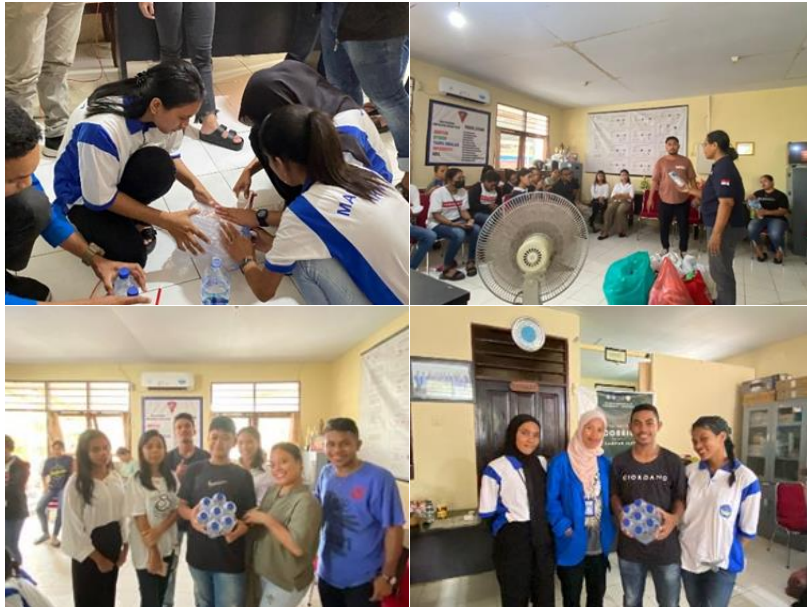
Gambar 3. Pelaksanaan Pelatihan Ecobrick bersama Bank Sampah Alstonia, Pemuda-Pemudi Kelurahan Batu Gajah dan Mahasiswa KKN Unpatti Angkatan XL IX-Gelombang II

Keberhasilan dari kegiatan ini ditunjukkan dengan antusias peserta pada saat berlangsungnya penyampaian sosialisasi dimana beberapa peserta aktif bertanya terkait materi sosialisasi yang diberikan. Selain itu, adapun kerjasama yang baik dari setiap peserta yang dibentuk dalam kelompok pada saat pelatihan berlangsung. Singkatnya, 20 pemuda-pemudi di Batu Gajah yang hadir memperoleh banyak informasi juga ilmu baru lewat sosialisasi dan pelatihan tentang jenis-jenis sampah plastik, proses dan berapa lama yang dibutuhkan untuk penguraian sampah plastik, dampak sampah plastik bagi lingkungan serta bagaimana pemilahan serta pengolahan sampah plastik secara baik dan benar.