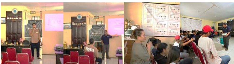
Gamabr 2. Penyampaian Sosialisasi oleh BS Alstonia dan Green Mollucas

Berikutnya dilanjutkan dengan Sosialisasi kedua yaitu tentang berbagai jenis sampah plastik, berapa lama dan bagaimana proses penguraiannya, dampak apa yang ditimbulkan dari banyaknya sampah plastik serta pentingnya peran anak muda dalam upaya mengurangi sampah plastik melalui cara yang benar saat melakukan pemilahan juga pengelolaan sampah plastik. Selain itu, diperkenalkan pula fasilitas Bank Sampah sebagai tempat pemilahan dan pengumpulan sampah yang dapat didaur kemudian digunakan kembali sehingga memiliki nilai ekonomi