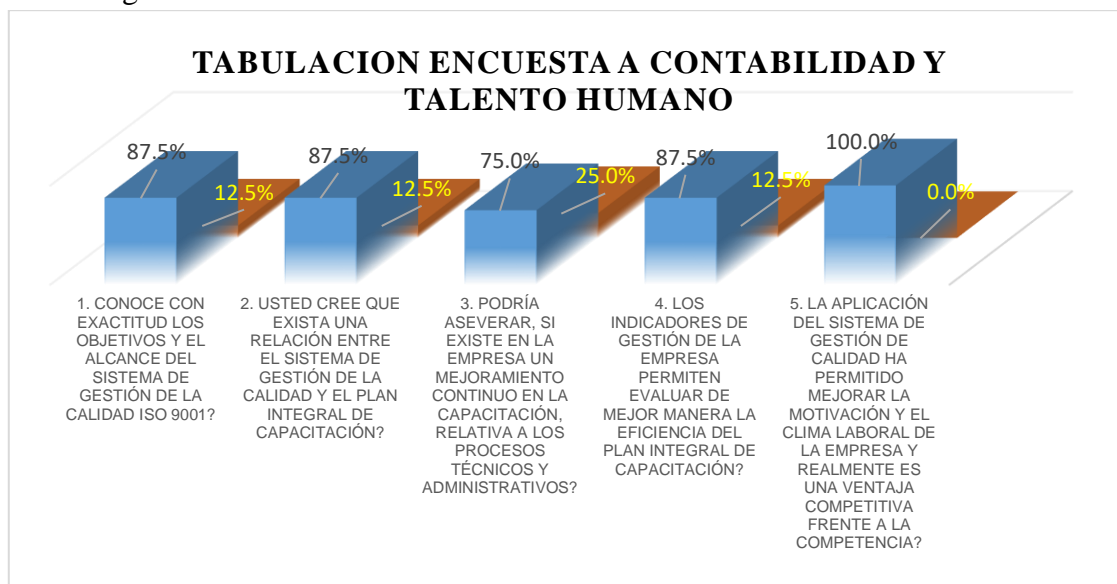
Figura No. 3 Tabulación encuesta a los departamentos financiero- contable y talento humano