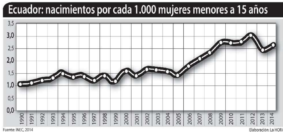
Tabla N 3. Ecuador Nacimientos por cada 1.000 mujeres menores a 15 años