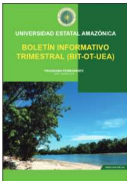
Figura 2. Portada del primer Boletín Informativo Trimestral (BIT-OT-UEA)

Finalmente, el OT-UEA se encargará de institucionalizar este programa para convertirlo en un referente de la información estadística y posteriormente posicionarse como un instrumento cuantitativo de medición, monitoreo y evaluación del comportamiento y tendencias de la demanda turística que estará disponible para toda la colectividad. Su funcionamiento se realiza en base a las variables que requieren los diferentes actores turísticos y considerando que el turismo es un sector de crecimiento acelerado es necesario disponer de información confiable que sea una verdadera herramienta de gestión. Actualmente, se han identificado un total de 98 observatorios turísticos, distribuidos en 27 países (sólo el 77% están en funcionamiento), mismos que son organismos importantes ya que sustentan la toma de decisiones tanto de la oferta como la demanda (Blasco & Cuevas, 2013; Molina & Báez, 2017).