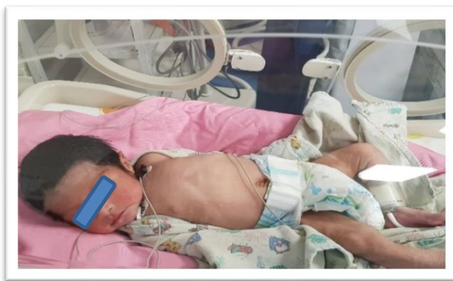
Imagen N.2: Recién nacido al momento del ingreso al servicio.

2.- El segundo caso habla sobre un RN con madre de 24 años de edad sin antecedentes patológicos de importancia, que no se realiza controles prenatales ni ecos, pero si consumo de hierro y ácido fólico, embarazo sin complicaciones, el parto fue a término, eutócico en hospital, con una antropometría al nacimiento de 3140g de peso, 46cm de talla y 35cm de perímetro cefálico y APGAR 8-9. Madre acude a emergencias de nuestra casa de salud con RN masculino de 7 días de vida, refiriendo que hijo hace 3 días previos presenta succión irregular, llanto fuerte con dificultad para descansar; 24 horas antes presenta mala succión y dificultad para deglutir, además vómitos por varias ocasiones. Se decide su ingreso y al examen físico se presenta hipoactivo pero reactivo al manejo, palidez generalizada, abdomen distendido y con ruidos hidroaéreos aumentados, extremidades hipertónicas (espásticas, semirrígidas) además ingresa con un peso de 2686g.