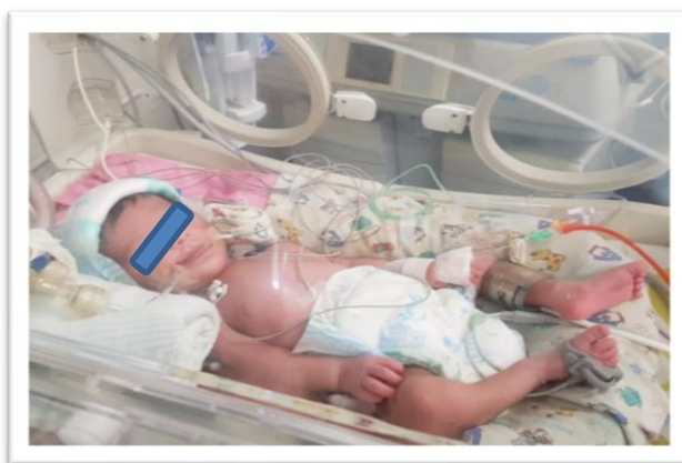
Imagen N.3: Recién nacido a los 25 días de vida, se encuentra en ventilación mecánica.

realiza nuevos exámenes de laboratorio, incluyendo además otro eco transfontanelar y un screening metabólico. RN con aumento de dificultad respiratoria por lo que se le pasa a DUOPAP nasal, se recibe reporte de eco el cual menciona Hemorragia de la Matriz germinal derecha e izquierda Grado I. Recién Nacido con persistencia de deterioro neurológico, por lo que se empieza a tratar como un Error innato del metabolismo, se deja en NPO por la mala tolerancia oral y déficit neurológico caracterizado por apertura ocular no espontánea, pupilas isocóricas hiporreactivas a la luz, no dirige mirada al estímulo auditivos, sostén cefálico débil e hipotonía muscular; recién nacido que por deterioro clínico que incluye además una neumonía recibe antibióticos y pasa a ventilación mecánica y a los 29 días de vida fallece.