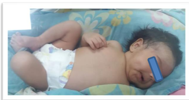
Imagen N.1: Recién nacida a los 4 días de hospitalización