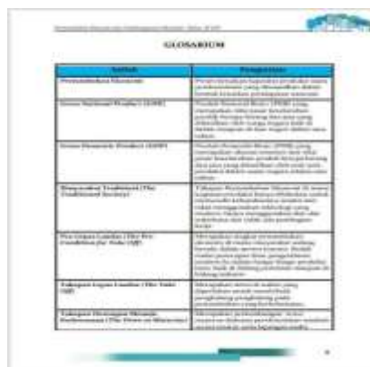
Gambar 4. Glosarium

Pada glosarium ini, berisi daftar istilah penting yang dilengkapi dengan penjelasannya atau definisi.