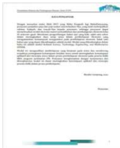
Gambar 2. Kata pengantar

Kata pengantar memuat beberapa komponen seperti gambaran umum dari Modul Digital, ucapan syukur penulis, dan harapan penulis atas pengembangan Modul Digital.