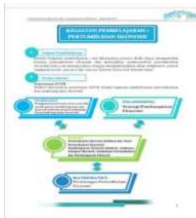
Gambar 7. Kegiatan Pembelajaran

Kegiatan pembelajaran berisikan tentang tujuan pembelajaran, uraian materi, rangkuman, penugasan mandiri, uji kemampuan, dan penilaian diri.