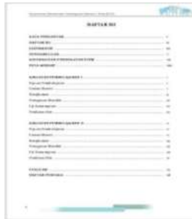
Gambar 3. Daftar Isi

Daftar isi dalam Modul Digital bertujuan untuk memudahkan pengguna dalam menemukan sub materi dan berpindah dari kehalaman yang diinginkan.