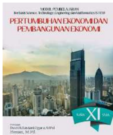
Gambar 1. Cover Modul Digital

Sampul modul digital terdiri atas judul “Modul Pembelajaran Berbasis Science, Technology, Engineering dan Mathematic : Pertumbuhan dan Pembangunan Ekonomi”.