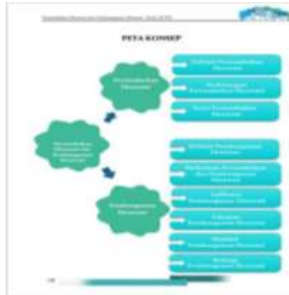
Gambar 6. Peta konsep

Peta konsep menjabarkan tentang materi yang ada di dalam Modul Digital yang mana akan dipelajari oleh pengguna.