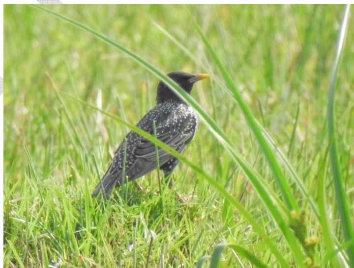
Figura 1. Estornino Pinto, Sturnus vulgaris , en Volendam, departamento de San Pedro, septiembre de 2021.

Aunque aún no existen registros ni indicios de nidificación en el país, consideramos que es vital prestar atención a su presencia en Paraguay, teniendo en cuenta que el Estornino Pinto es una especie invasora y dañina para los ecosistemas nativos (Linz et al. , 2007), además de un potencial reservorio y vector de agentes patógenos por sus hábitos gregarios y de desplazamiento (Cabe, 2021). Por ejemplo, en Argentina se han reportado daños a cultivos (Ibañez et al. , 2016b) y ocupación de nidos realizados por especies de aves nativas ( e.g. , Rizzo, 2010; Chimento, 2015; Ibañez et al. 2017).