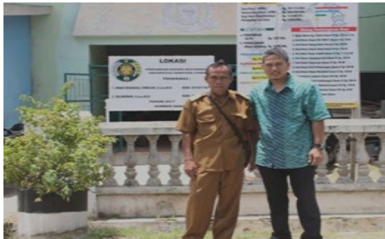
Gambar 4. Plang Pengabdian

Dilakukannya pelatihan pengelolaan perpustakaan desa terutama dalam kegiatan pencatatan. Perangkat desa dilatih untuk mengelola perpustakaan melalui pemberian kode dan penomoran buku-buku, penyusunan, sampai sistem peminjaman yang dapat dilakukan oleh anak-anak. Saat ini kepala desa dan sekretaris desa akan segera menunjuk salah satu dari perangkat desa yang sudah mengikuti pelatihan untuk bertugas dan bertanggung jawab terhadap pengelolaan perpustakaan desa. Peserta pelatihan dilatih sampai mahir melakukan pencatatan dan pengkodean serta penomoran buku dan proses administrasi lainnya.