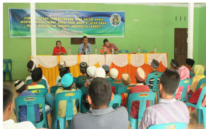
Gambar 3. Sosialisasi Pentingnya Membaca

Pada pengabdian masyarakat di Desa Aman Damai, juga dilakukan sosialisasi bagaimana pentingnya membaca pada anak, yang diikuti oleh anak-anak sekitar desa Aman Damai Kecamatan Sirapit. Materi yang disampaikan pada saat sosialisasi adalah pentingnya membaca dan dijelaskan bagaimana peran membaca bagi orang-orang yang sudah sukses, lalu tata cara membaca yang baik, manfaat dari membaca bagi anak-anak. Selama sosialisasi dilakukan sesi tanya jawab dengan peserta sosialisasi dan juga dari diberikan beberapa pertanyaan kepada peserta dengan mengapresiasi mereka pemberian beberapa hadiah.