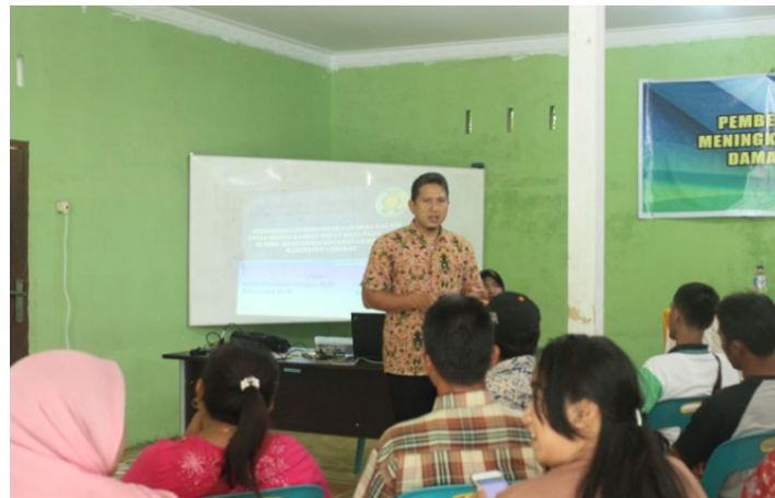
Gambar 2. Penyuluhan

Penyuluhan dan sosialisasi yang dilakukan itu bertujuan untuk menyampaikan beberapa informasi kepada anak di desa tersebut tentang pentingnya membaca dan manfaat membaca buku. Sehingga diharapkan dengan berbagi beberapa informasi tersebut anak-anak di Desa Aman Damai Kecamatan Sirapit Kabupaten Langkat akan mengerti manfaat dari banyak membaca buku-buku yang mengandung ilmu pengetahuan.