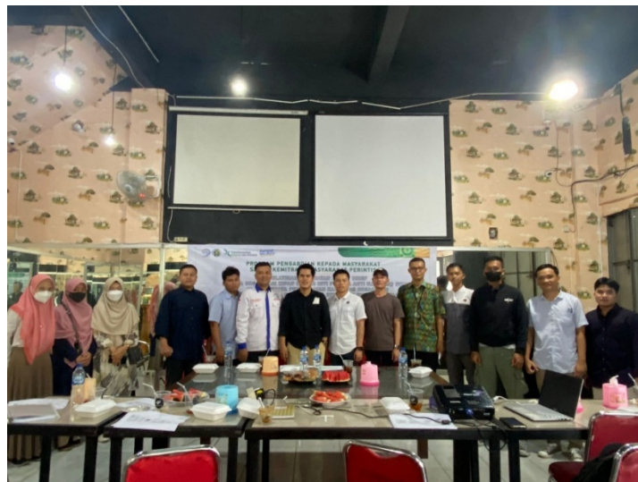
Gambar 5. Momen ketika sesi pelatihan selesai dan foto bersama antara pemateri dan peserta pelatihan

Dari hasil pre dan post-test di atas terlihat bahwa ada peningkatan pemahaman yang cukup signifikan pada masing-masing peserta. Saat pre-test, nilai total dari semua peserta hanya sebanyak 910 skor dan hasil post-test setelah pelatihan menjadi sebanyak 1.810 skor. Terdapat peningkatan sebanyak 900 skor dari sebelum dan setelah pelatihan dilakukan. Rata-rata nilai peserta sebelum pelatihan hanya sebanyak 45.5 dan setelah pelatihan meningkat menjadi 90.5. Kemudian nilai paling tinggi (maksimum) peserta hanya berkisar pada angka 60 dan setelah pelatihan bertambah menjadi 100. Dari data kuesioner pre dan post-test ini dapat disimpulkan bahwa pemahaman peserta pelatihan pembuatan Policy Brief di organisasi KIPAN Sumut mengalami peningkatan. Dengan demikian maka dapat dikatakan bahwa pelatihan ini telah berdampak secara positif bagi peserta pelatihan.