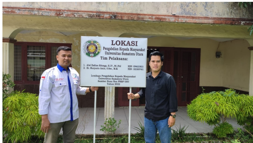
Gambar 7. Momen pemasangan plang kegiatan antara Ketua KIPAN Sumut dengan Ketua Tim Pengabdian