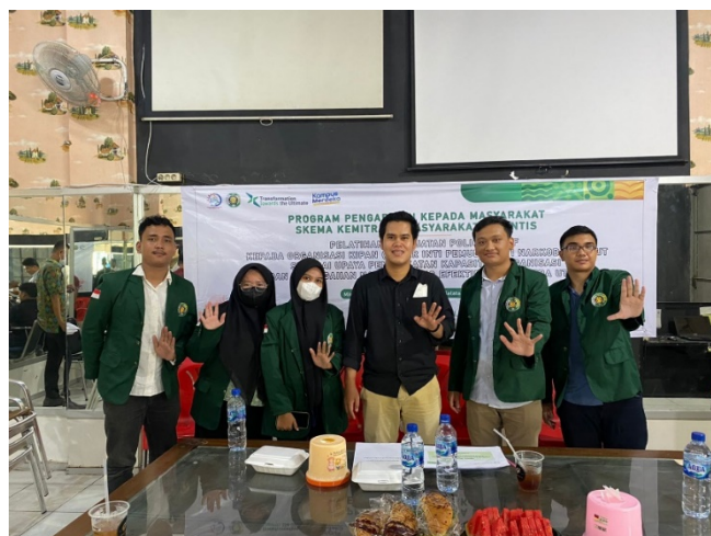
Gambar 6. Momen foto bersama dengan mahasiswa tim pengabdian