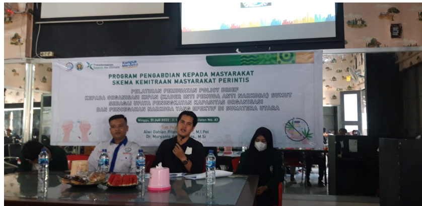
Gambar 3. Momen ketika pelatihan sedang berlangsung

Kegiatan pelatihan ini dilaksanakan pada tanggal 31 Juli 2022 sekitar pukul 12.30 sampai 16.30 di salah satu café di daerah Jalan Halat Kota Medan. Tempat ini dipilih setelah meminta pertimbangan dari ketua KIPAN Sumut dengan alasan agar suasana pelatihan tidak terlalu formal dan lebih rileks dan santai bagi para peserta. Kegiatan pelatihan formal diikuti sebanyak 20 orang peserta yang terdiri dari pengurus dan anggota biasa.