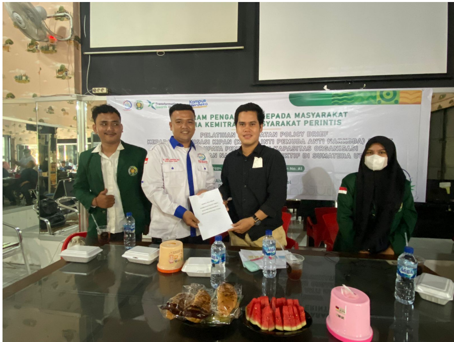
Gambar 4. Momen ketika pemateri menyerahkan modul pelatihan kepada Ketua KIPAN SUMUT

Sebelum masuk ke inti modul, para peserta diberikan kuesioner berupa soal-soal pre-test untuk mengetahui tingkat pemahaman awal masing-masing peserta tentang materi pelatihan yang akan diberikan. Setelah sesi pelatihan selesai kemudian peserta kembali diminta untuk menjawab lembar kuesioner (post-test) dengan pertanyaan serupa pada pre-test. Hal ini dilakukan untuk melihat progress peningkatan pemahaman masing-masing peserta terhadap materi yang telah diberikan. Hasil pre dan pos test dapat dilihat pada tabel di bawah ini: