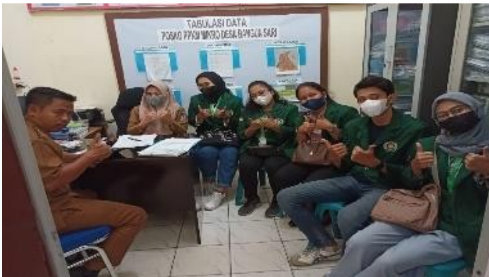
Figure 3 . Foto Tim Pengabdian dengan Perangkat Desa