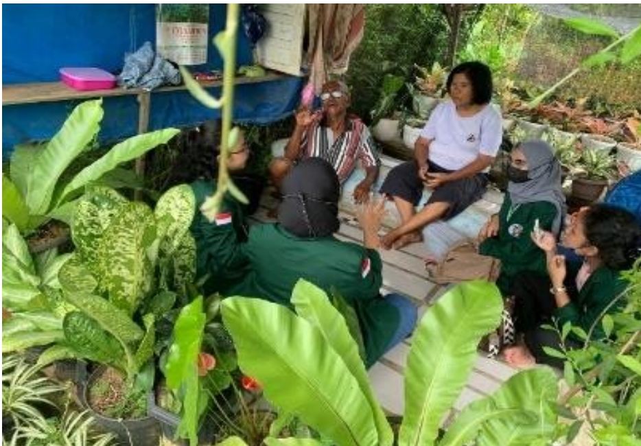
Figure 5 . Momen Ketika Tim Memberikan Pembimbingan Kepada Pedagang Bunga