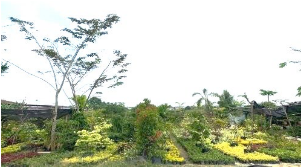
Figure 2 . Foto Salah Satu Taman Bunga Milik Warga

Hasil dari kegiatan SOSMEDSOS di Desa Bangun Sari Lama Kecamatan Tanjung Morawa Kabupaten Deli Serdang pada mata kuliah kebijakan publik adalah informasi ataupun penyampaian materi yang diberikan kelompok kami berjalan dengan baik. Hasil yang diperoleh masyarakat dalam hal penggunaan media sosial sebagai alat untuk membantu sektor jual beli tanaman bunga mereka berjalan dengan sebagai mana mestinya. Kemudian masyarakat merespon dengan baik sosialisasi yang kami berikan. Selanjutnya pendaftaran akun untuuk membantu proses jual beli tanaman bunga yang mereka jual, dengan bantuan dan panduan dari kelompok kami, dan yang terakhir dokumentasi sebagai bukti pelaksanaan kegiatan.