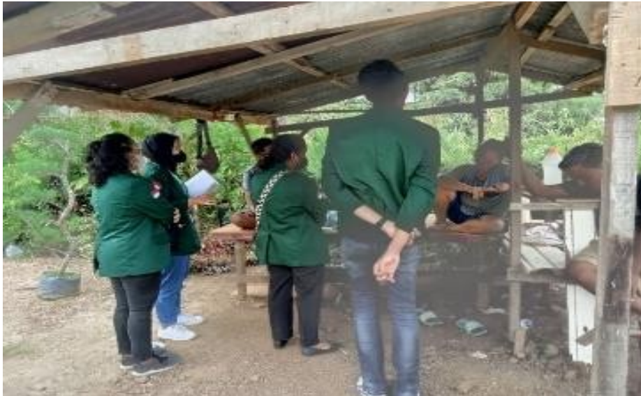
Figure 4 . Momen Ketika Tim Menjumpai dan Menyebarkan Angket Kepada Pedagang Bunga