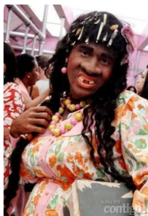
Figura 01 – “Adelaide” Estereótipo da mulher negra exibido no programa Zorra Total (Globo).

principalmente, em programas de humor e entretenimento, e nas redes sociais não é diferente; aliás nelas podemos observar posicionamentos propagam o racismo recreativo que, segundo Moreira (2019, p. 31), é um conceito que designa um tipo específico de opressão racial que compreende a circulação de imagens que depreciam minorias em forma de humor. Ambos programas, foram alvo de críticas, pois reforçam ideias hegemônicas e preconceituosas, mas a pergunta que devemos nos fazer é: porque, essas narrativas ainda são recorrentes?