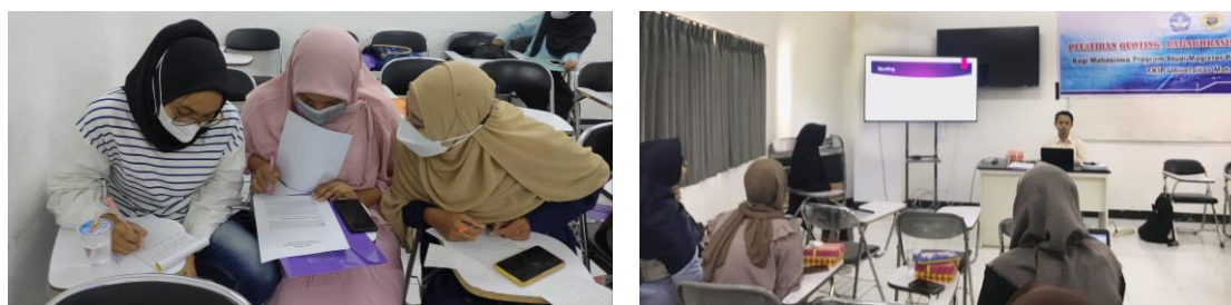
Gambar 1. Kerja Kelompok (kiri) dan Presentasi Hasil (kanan)

Pada pertemuan kedua, yakni tanggal 23 Juli 2022, perwakilan dari setiap kelompok mempresentasikan hasil kerja kelompok mereka yang ditulis dalam slide PowerPoint yang dilanjutkan dengan sesi evaluasi dan pemberian feedback dari para peserta dan tim atau pemateri kegiatan pengabdian. Dari keseluruhan hasil kerja kelompok yang dipresentasikan, dapat dinyatakan bahwa para peserta sudah memahami dan mampu untuk melakukan kegiatan quoting , paraphrasing , dan summarizing dengan baik.