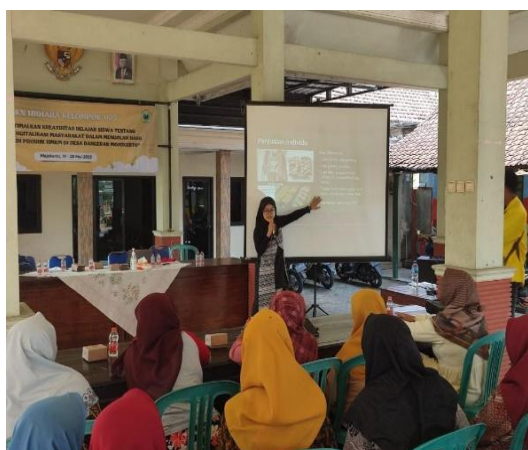
Gambar 4. Sosialisasi Mengolah Sayuran dan Lele

Pasar online atau lebih dikenal dengan market place yaitu masyarakat berbelanja melalui gawai tanpa harus ke toko. Belanja online merupakan kegiatan transaksi pembelian dan penjualan produk maupun jasa secara langsung di internet melalui market place yang tersedia, pelanggan dapat melihat deskripsi, spesifikasi, dan kualitas produk pada laman produk yang ditampilkan di market place [13].