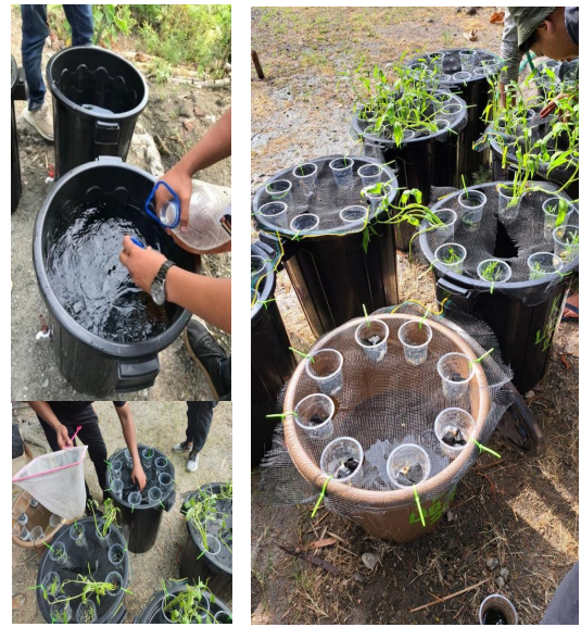
Gambar 3. Proses Pemupukan Lele dan Budidaya Lele serta Kangkung Aquaponik

menanam kangkung aquaponik agar semakin banyak tanaman yang bisa tumbuh untuk dijual sebagai produk UMKM dan menjadi tambahan bahan pangan juga pemasukan ekonomi warga desa. Hasilnya bibit kangkung bisa tumbuh selama tiga hari dan masa panen sayur kangkung satu bulan, sedangkan untuk lele bisa dipanen satu sampai dua bulan dengan ukuran 20 cm (Gambar 3).