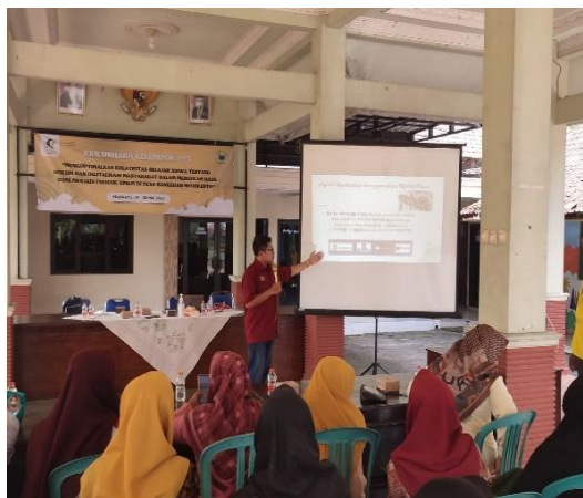
Gambar 5. Sosialisasi Pemasaran Produk