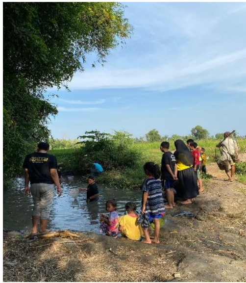
Gambar 2. Pengambilan Bibit Lele di Sungai

Dikarenakan lahan masih ada dan tutup ember tidak terpakai, dimanfaatkan untuk