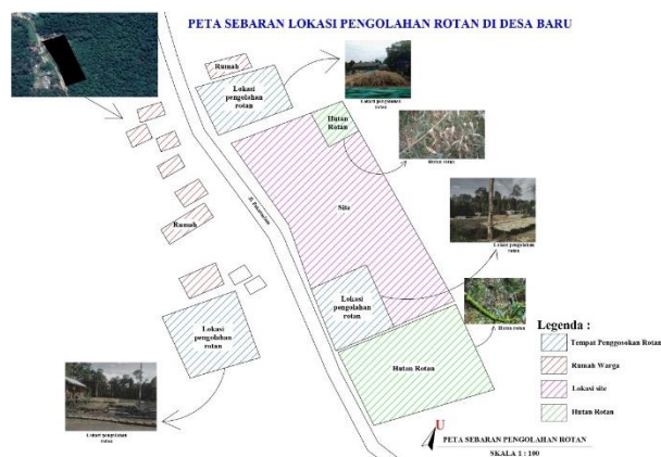
Gambar 5. Sebaran Lokasi Pengolahan Rotan.

Arahan pengembangan pariwisata di Kecamatan Dusun Selatan, Kabupaten Barito Selatan meliputi, visi dan misi, bentuk struktur kawasan, fungsi kawasan wisata, pola perjalanan dan paket wisata, infrastruktur, promosi, serta kelembagaan. Visi dan misi kepariwisataan di Kecamatan Dusun Selatan, yaitu: "Menjadikan Kecamatan Dusun Selatan sebagai Daerah Tujuan Wisata (DTW) utama di Kabupaten Barito Selatan dengan pengembangan wisata alam yang berbasis lingkungan" (Dinas Kebudayaan dan Pariwisata Kabupaten Barito Selatan, 2010). Arah pengembangan pariwisata salah satunya pengembangan prospek kerajinan rotan di Desa Baru mempunyai keunggulan potensi infrastruktur, sebaran fasilitas sarana dan prasarana, serta potensi pengrajin rotan di Desa Baru seperti tertera pada Gambar 5.