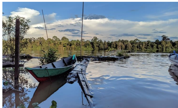
Gambar 2. Desa Wisata Danau Sadar.

Wisata air di Kecamatan Dusun Selatan, antara lain: Danau Sadar, Danau Sababilah, Danau Baru, Danau Malawen seperti tertera pada Gambar 2.