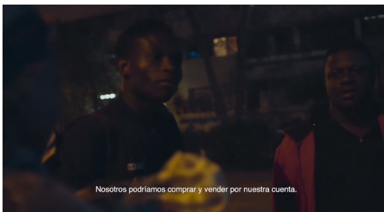
Fotograma 9. Steevens se dirige al grupo (Cáceres 01:02:35).

En la siguiente escena, Steevens observa a su jefe mientras sus compañeros retiran los Súper 8 para ir a trabajar. El jefe reta a una mujer haitiana porque ha traído a su bebé, quien explica que no tiene con quien dejarlo. El jefe se dirige al grupo y dice: “Yo no me puedo hacer cargo de sus problemas”. Steevens mira a la mujer (en fuera de campo) y al jefe alternativamente. Luego lo vemos vendiendo en una intersección. La mujer está vendiendo al frente, donde se encuentran también los jóvenes que estacionan autos. Mientras Steevens cuenta sus monedas, escucha el ruido de sirenas y ve cómo se acercan dos carabineros. Reacciona, corre y saca el coche del bebe antes de que estos lleguen, y alcanza a huir con la mujer.