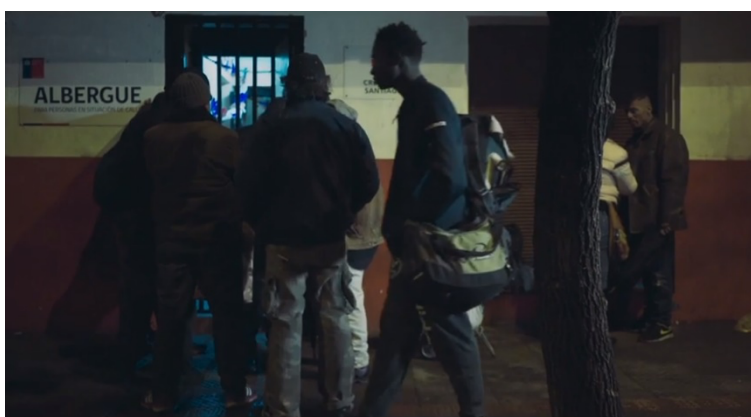
Fotograma 2. El albergue (Cáceres 00:54:15).

El crítico Álvaro García lee en esta escena una referencia al modo en que estos personajes se mantienen ocultos en la ciudad, fuera del alcance del ojo vigilante del Estado. En este sentido, hay que notar que este modo de presentar la ciudad y a los “ayudantes” de Steevens indica una ausencia muy importante del Estado en la experiencia del migrante. Es decir, el Estado chileno aparece, pero solo desde una actoría persecutoria: el Estado que se querrela contra Steevens por la agresión contra su jefe o el Estado que llega a controlar la venta de productos en su segundo trabajo a través de la policía. Si el único modo de ser albergado, de recibir hospitalidad, viene de otros marginales, de otros que se han vuelto iguales (hasta cierto punto) a Steevens expulsado de su comunidad, es también porque el Estado no está disponible en una posición de apoyo o cuidado para ellos.