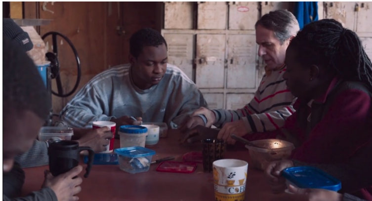
Fotograma 4. El almuerzo en la fábrica (Cáceres 00:24:30).

Como comenté anteriormente, el lugar central donde se articula la narrativa de Perro bomba es el espacio laboral. Steevens logra conseguirle trabajo a Junior en la fábrica de ladrillos donde trabaja, a pesar de que este no tiene “papeles” ni habla español. En la fábrica los compañeros de trabajo también son migrantes, aunque de otras nacionalidades. Un día, cuando Junior ya se ha integrado a las labores, los trabajadores hacen una pausa para almorzar. Entonces llega el jefe a la mesa y se sienta al lado de Steevens indicando que quiere conocer más a Junior. Este, como no entiende, que Steevens le traduzca. “Tu amigo tuvo que suplicarme de rodillas que te diera trabajo”, dice el jefe. Junior pregunta qué dice y Steevens le responde: “Tonterías, solo dile que sí y sonríe”. “En Chile no había negros”, continúa el jefe: