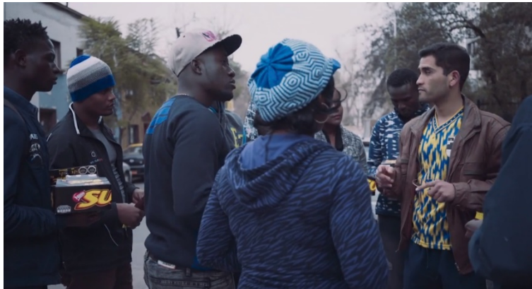
Fotograma 7. La venta de Súper 8 (Cáceres 00:49:16).

La deriva de Steevens por la ciudad luego de su expulsión lo lleva a buscar formas de enfrentar su situación. La primera es su situación legal. Mediante un afiche en la residencia donde encuentra una pieza, Steevens llega hasta una organización de apoyo a migrantes para conversar con una abogada. Luego de orientarlo en torno a la querrela en contra suya, ella le advierte que su situación puede verse complicada si es descubierto en actividades informales.