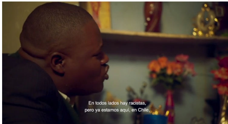
Fotograma 3. El invitado (Cáceres 00:07:45).

Condensada en una de escenas iniciales del filme encontramos una primera referencia a una inclinación del personaje Steevens a enunciar la verdad de una situación asumiendo los riesgos de ese acto. Se trata de una secuencia en la que un invitado come en la mesa junto a Steevens y el matrimonio que le arrienda la pieza. La conversación en creole parte agradeciendo a Dios la comida y rezando. El invitado comenta que Dios sabrá, porque cuando un negro o un blanco se cortan, la sangre es del mismo color, y continúa: