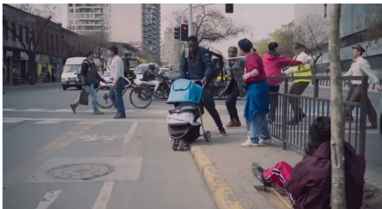
Fotograma 8. Steevens escapa de la policía (Cáceres 01:01:45).

En la siguiente escena, Steevens observa a su jefe mientras sus compañeros retiran los Súper 8 para ir a trabajar. El jefe reta a una mujer haitiana porque ha traído a su bebé, quien explica que no tiene con quien dejarlo. El jefe se dirige al grupo y dice: “Yo no me puedo hacer cargo de sus problemas”. Steevens mira a la mujer (en fuera de campo) y al jefe alternativamente. Luego lo vemos vendiendo en una intersección. La mujer está vendiendo al frente, donde se encuentran también los jóvenes que estacionan autos. Mientras Steevens cuenta sus monedas, escucha el ruido de sirenas y ve cómo se acercan dos carabineros. Reacciona, corre y saca el coche del bebe antes de que estos lleguen, y alcanza a huir con la mujer.