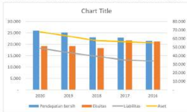
Grafik 1. Kinerja Keuangan