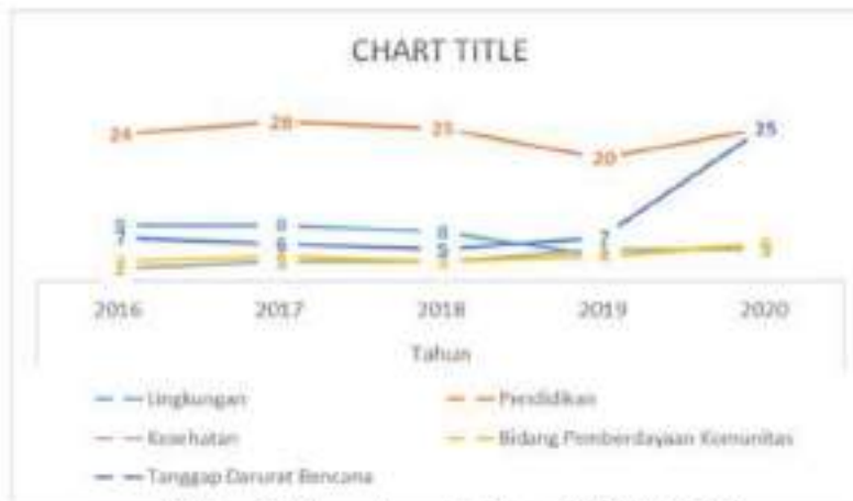
Gambar 2. Pengungkapan Kegiatan CSR 2016 – 2020.

sekolah saja, namun pendidikan dapat dilakukan diluar rumah, maupun masuk pada bidang keterampilan tertentu, misalnya pada bidang vokasi yang terdiri dari keahlian yang diakui oleh instansi terkait.