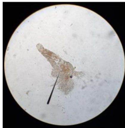
Gambar 4. Larva larutan uji 5640 ppm