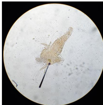
Gambar 3. Larva larutan uji 10.000 ppm