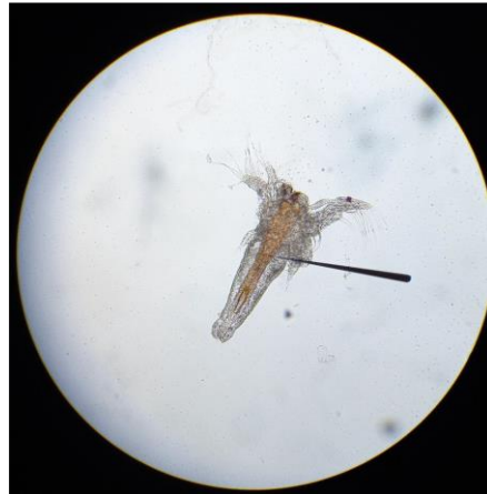
Gambar 2. Larva kontrol negatif

mandibula, pergeseran stigma, penyusutan pada kedua antena, perubahan bentuk antenula, kehilangan sepasang antenula, dan perubahan warna tubuh dapat menyebabkan gangguan osmoregulasi dan ketidakseimbangan pergerakan Artemia salina (Ntungwe et al., 2020).