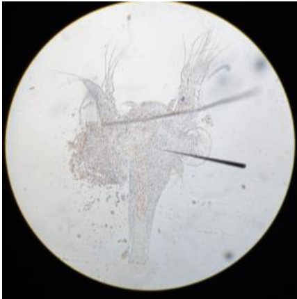
Gambar 5. Larva larutan uji 3168 ppm