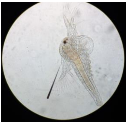
Gambar 6. Larva larutan uji 1780 ppm