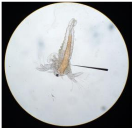
Gambar 7. Larva larutan uji 1000 ppm