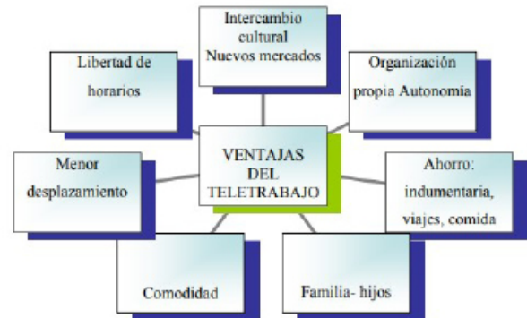
Figura 2: Algunas ventajas predominantes en el teletrabajo Fuente: (Paternó, Suarez Kimura, & Viola, 2010).

Actualmente, la nueva modalidad laboral, es el teletrabajo que de una manera u otra se ha convertido en un fenómeno de las redes digitales, de tal manera, que las personas se integran e involucran en este tema para buscar mejorar su situación socioeconómica laboral.