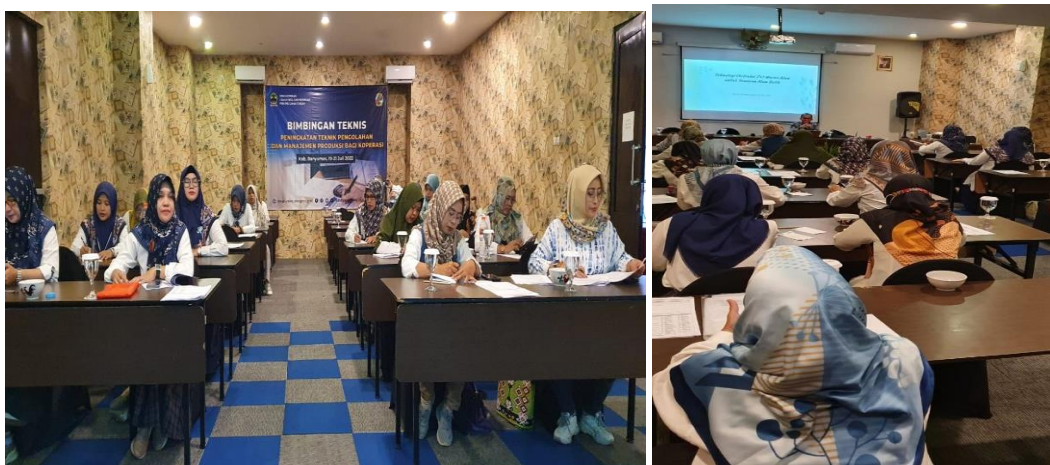
Gambar 1. Focus Group Discussion Proses Ekstraksi Zat Warna Alami Kain Batik

Sedangkan zat warna tekstil alami terbuat dari zat warna yang berasal dari ekstrak tumbuhan (seperti bagian daun, bunga, biji). Warna yang dihasilkan kurang stabil, mudah berubah oleh pengaruh tingkatan keasaman tertentu, untuk mendapatkan pewarna yang bagus diperlukan bahan-bahan pewarna yang lebih banyak. Keaneka ragaman warna yang terbatas. Pada proses pewarnaan, tingkat keseragaman warna kurang baik. Karena berasal dari tanaman, akan memberikan rasa/aroma yang khas. Banyak pertanyaan yang disampaikan oleh peserta, seperti apa kelebihan zat warna alami kain batik? proses apa yang paling mudah dan murah untuk proses ekstraksi zat warna alami?