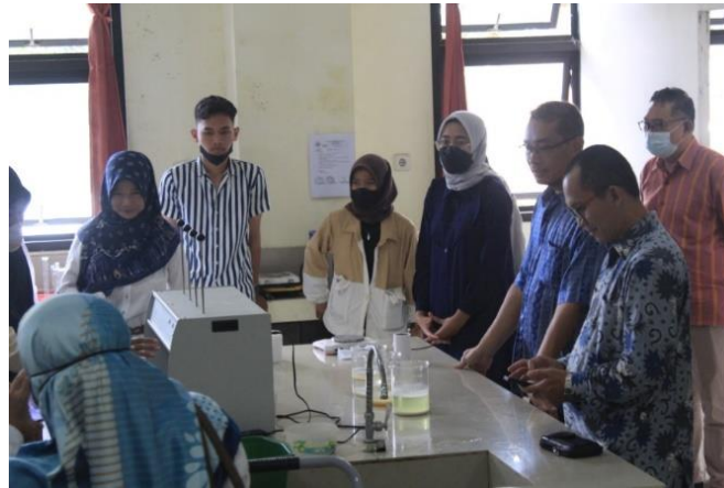
Gambar 4. Praktek Ekstraksi Zat Warna Alami