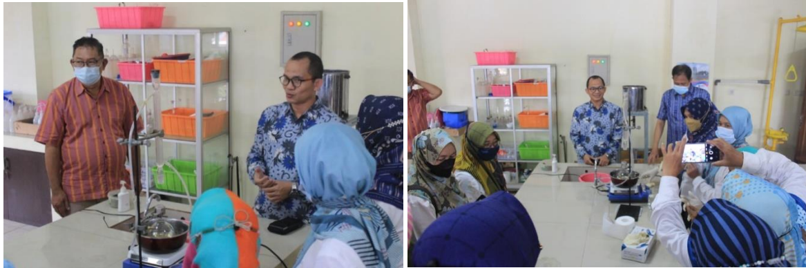
Gambar 2. Praktek Ekstraksi Zat Warna Alami

metode koagulasi. Proses ekstraksi yang dilakukan adalah proses water distillation . Pada proses water distillation , bahan direndam dalam air kemudian dipanaskan sampai warna yang terkandung dalam bahan keluar. Gambar 2 menunjukkan proses praktek ekstraksi zat warna alami dari kulit manggis. Gambar 3 menunjukkan beberapa bahan yang dapat dijadikan sebagai zat warna alami kain batik.