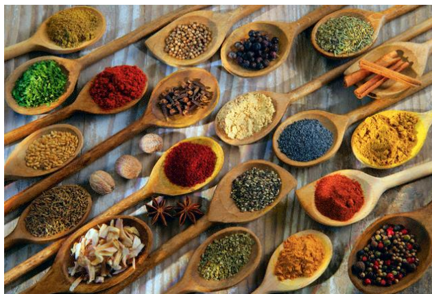
Gambar 3. Bahan Zat Warna Alami Kain Batik

Proses pengolahan limbah zat warna batik dapat dilakukan dengan empat tahapan, yaitu: proses primer, proses sekunder dan proses tertier. Proses primer adalah proses pertama merupakan proses fisik yang berupa penyaringan bertujuan untuk menghilangkan partikel-partikel padatan. Proses sekunder adalah proses lanjutan yang berupa proses kimia dan/atau proses biologis. Proses kimia dapat berupa proses pengendapan dengan penambahan senyawa koagulan seperti ferri sulphat dan tawas. Hasil pengujian efektifitas bahan koagulan ferri sulphat Fe_2(SO_4)_3 atau tunjung dan KAl(SO_4)_2 \cdot 12H_2O (tawas) diperoleh hasil bahwa tawas lebih efektif dan murah dalam pengolahan limbah batik. Sedangkan proses biologis adalah pengolahan limbah zat warna dengan menggunakan mikroorganisme pengurai, baik secara aerob dan anaerob. Gambar 4 menunjukkan praktek pengolahan limbah batik dengan metode koagulasi. Gambar 5 menunjukkan metode pengolahan limbah zat warna tekstil secara umum.