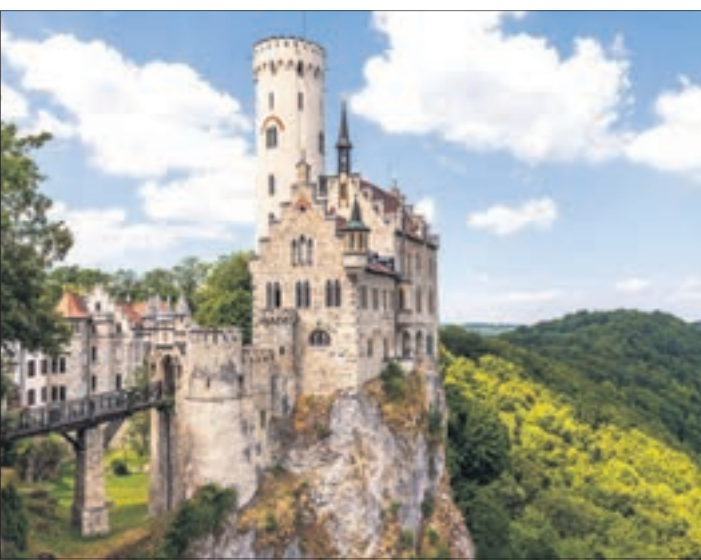
In ganz Deutschland lassen sich atemberaubende Burgen und Schlösser betrachten.