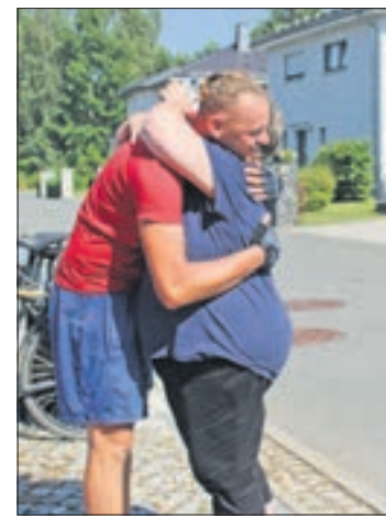
Beide Mütter sind überglücklich, ihre Abenteurer unverseht wieder zu haben.

Zurück in ihrer Heimat wollen sie zunächst erst mal wieder richtig ankommen. Hier werden sie ihre Eindrücke und Erinnerungen der letzten Jahre Revue passieren lassen - ohne nicht dabei auch schon unbedingt Vorträge halten, um anderen von unseren Erfahrungen zu berichten und Ratschläge zu geben. Zudem könnten wir uns auch geführte Reisen nach Pakistan vorstellen.“ Eine Sache sei den beiden aber besonders wichtig: „Wir möchten auch den Menschen vor Ort, von denen wir so viel Liebe bekommen ha-