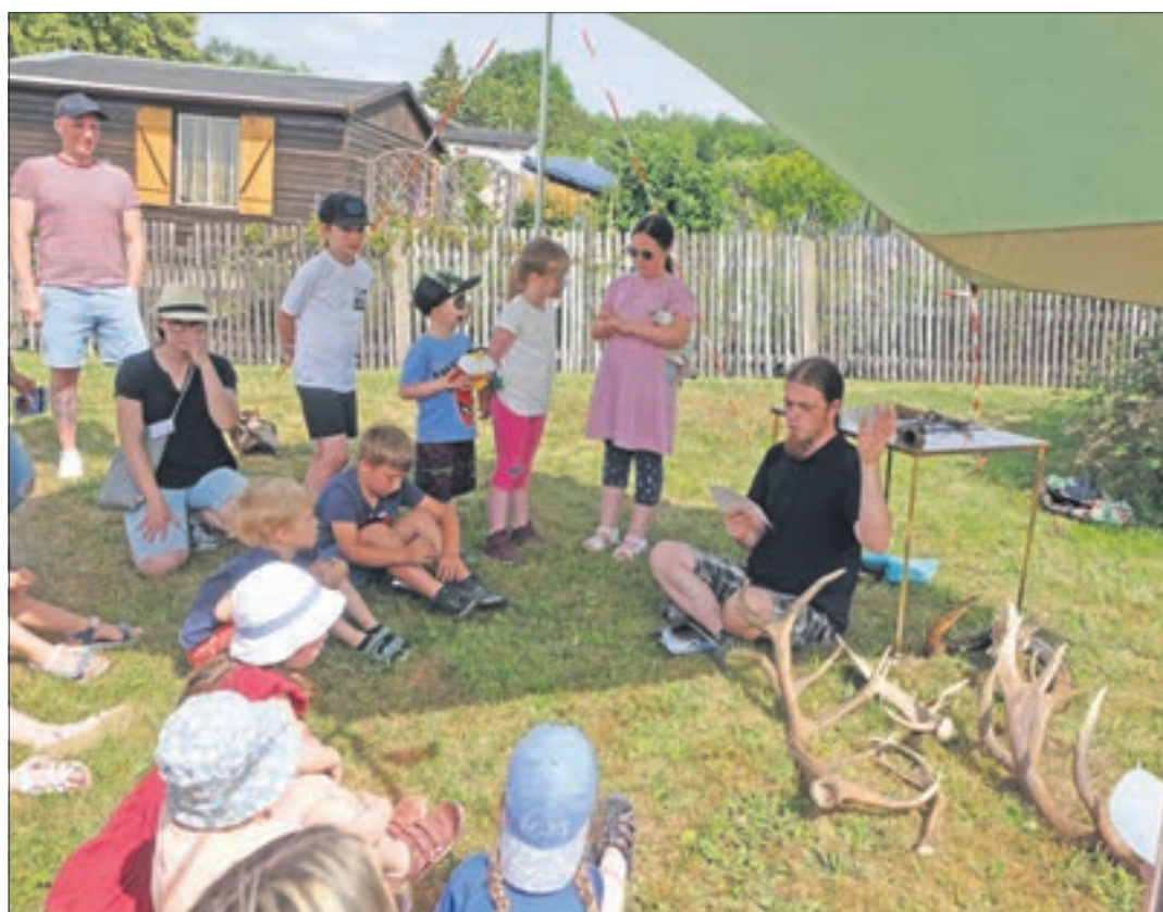
Vortrag zum Kinderfest über die Tiere im Wildgatter.