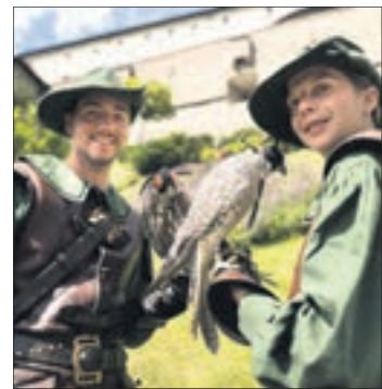
Historische Greifvögel lassen sich bei den Vorführungen des Landesfalkenhofs auf der Erlebnisburg Hohenwerfen aus nächster Nähe bestaunen.