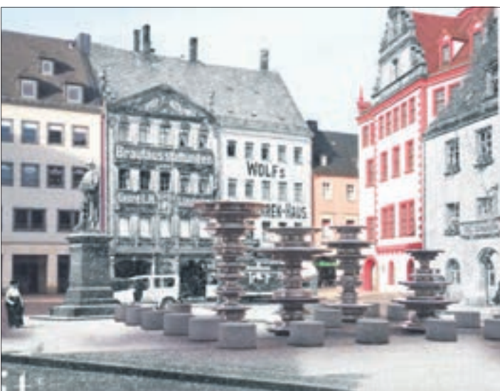
Mit der Ausgabe für 2024 erscheint der beliebte Kalender bereits in der 16. Auflage.