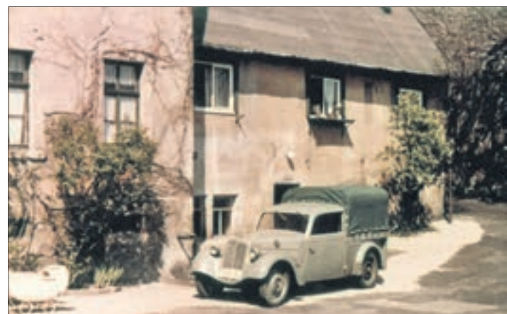
Historisches Foto des DKW F8.

bereits in Klaffenbach, nun soll er jedoch eine neue Heimat finden. Der bisherige Ausstellungsreich wird mit einer Camping-Szene aus DDR-Zeiten ausgestattet. Daher wird das Fahrzeug am 14. Oktober um 15 Uhr öffentlich versteigert. Das Startgebot liegt bei 500 Euro, wobei man sich für das Fahrzeug natürlich deutlich mehr erhofft. red