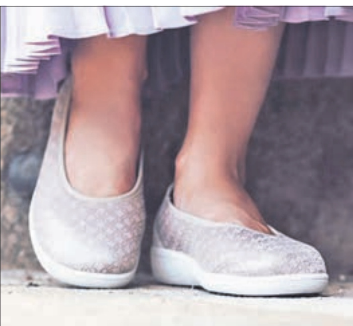
Durch den Schnitt der Modelle und die Materialkombinationen bieten Stretchschuhe besonders guten Halt und entlasten an den richtigen Stellen.

Stretchschuhe können sowohl bei Rheuma als auch bei Arthrose sinnvoll sein