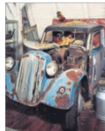
Das Foto zeigt den alten „Scheunenfund“.