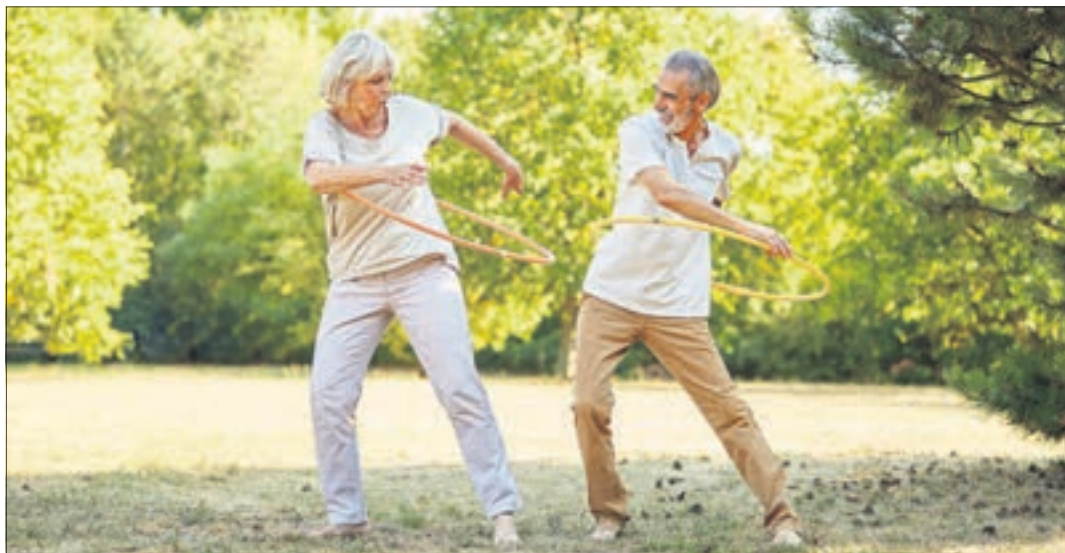
Das kostenfreie Bewegungsprogramm der TU Chemnitz und dem Amt für Gesundheit und Prävention soll mehr Schwung in die Chemnitzer Nachbarschaft bringen.

Chemnitz. Ab sofort können sich interessierte Senioren ab 75 Jahren der Stadtteile Grüna sowie Reichenbrand und Umgebung für ein kostenfreies Bewegungsprogramm anmelden. Es richtet sich vor allem an Seniorinnen und Senioren, die bisher nicht regelmäßig körperlich aktiv waren, aber ihre körperliche sowie geistige Aktivität verbessern möchten. Es findet im wohnortnahen Umfeld, in Parks und Grünanlagen statt. Entwickelt hat das gemeinsame Gesundheitsförderungsprogramm „BeTaSen – Bewegungs-Tandems in den Lebenswelten Chemnitzer Seniorinnen und Senioren“ die TU Chemnitz gemeinsam mit dem Amt für Gesundheit und Prävention der Stadt Chemnitz.