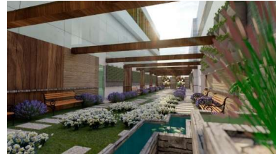
Gambar 4. Taman Terapi Rehabilitasi Medik

sejenisnya yang dapat memberikan Efek relaksasi serta dapat membantu mengurangi stres pada pasien. Selain itu pada taman dibuat kolam-kolam kecil untuk menghasilkan suara alam berupa aliran air yang dapat memberikan efek baik bagi psikologis pasien.