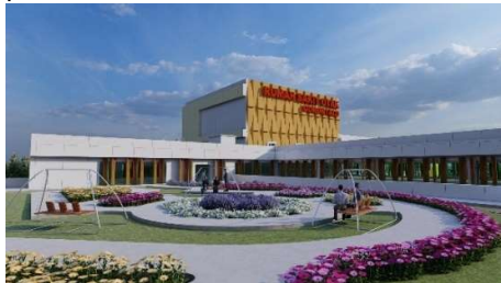
Gambar 2. Green Roof (Healing Garden) (Sumber: Konsep Penulis, 2022)

Pada atap bangunan menggunakan jenis atap green roof yang dimanfaatkan sebagai healing garden yang dapat diakses dari instalasi rawat inap. Menurut Koschnitzki 2011 (dalam Lidyana et al, 2013) healing garden merupakan salah satu taman yang ada di Rumah Sakit. Taman tersebut dirancang untuk dapat membantu proses pemulihan pasien.