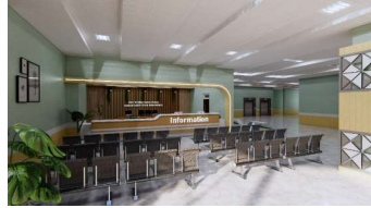
Gambar 6. Ruang Tunggu Lobby