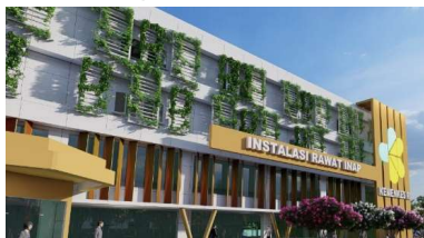
Gambar 3. Secondary Skin pada Fasad

Penggunaan secondary skin berupa Green Facade untuk menciptakan lingkungan yang lembut sehingga dapat menenangkan dan menghilangkan stress. Menurut Day 2003 (dalam Nugroho, 2019) Tanaman di dinding dan atap dapat melembutkan permukaan keras.