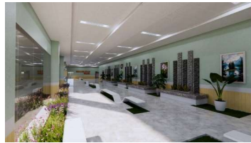
Gambar 7. Lobby

Selain itu, pada bagian koridor instalasi rawat inap diterapkan seni dalam ruangan berupa gambar-gambar latar yang menggambarkan pemandangan alam, elemen air dan tanaman yang dapat menjadi nilai estetika dan selingan visual.