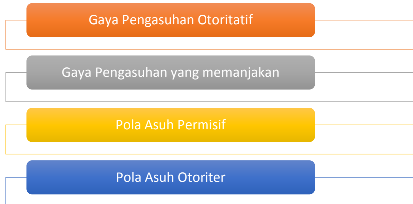
Gambar 2 Pola Asuh Yang Tidak Direkomendasikan

Harmonisasi kegiatan parenting dari bapak dan ibu di lapangan belum terjadi. Mengingat kegiatan pengasuhan yang responsif gender seharusnya dilakukan oleh ayah dan ibu dengan pembagian peran yang seimbang. Pola asuh yang dianut oleh kedua belah pihak terbagi menjadi ibu melakukan aktivitas yang mengarah pada aspek emosional (pemeliharaan, kedisiplinan, pendidikan karakter) sedangkan ayah lebih mengarah pada aspek fisik dan rekreasi. Jika kedua aspek ini digabungkan, dapat saling melengkapi dan membuat anak terbiasa dengan keragaman yang baik, terutama dalam melakukan tindakan. Kegiatan pengasuhan yang diberikan kepada anak laki-laki dan perempuan bertujuan untuk melatih anak meningkatkan kemampuannya dalam kualitas karir yang bermanfaat. Contoh sederhananya, perempuan dan laki-laki harus mendapatkan pendidikan yang terbaik. Jika hal ini diterima dengan baik maka kedua belah pihak dapat memberikan kontribusi dalam dunia kerja dengan kualitas yang baik pula. Pola asuh yang baik dalam hal ini adalah mendidik anak dengan menghilangkan kesenjangan atau dengan kata lain tidak memandang jenis kelamin dalam memaksimalkan kemampuan otak anak. Pada akhirnya, pola asuh yang baik adalah memberikan kasih sayang yang hangat secara fisik dan verbal. Selain pola asuh yang baik dilakukan dalam keluarga, ada beberapa pola asuh yang bisa dihindari orang tua, sebagai berikut: