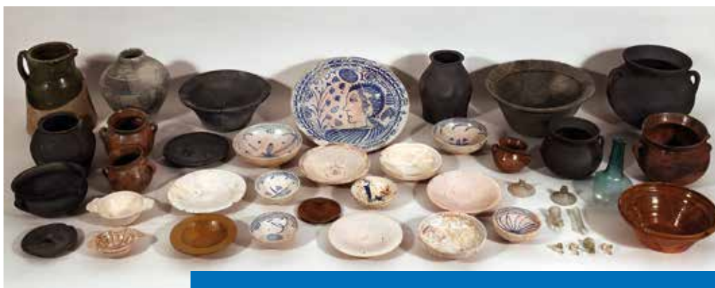
Conjunt ceràmic del segle XVI del Castell de Montsoriu.

Les produccions catalanes en reflex daurat ens aporten una cronologia una mica més avançada (1525-1550). Com a data ante quem , hem de subratllar que no hi ha cap exemplar de ceràmica catalana blava amb policromies posterior al 1570 ni pisa decorada en pinzell pinta de color blau.