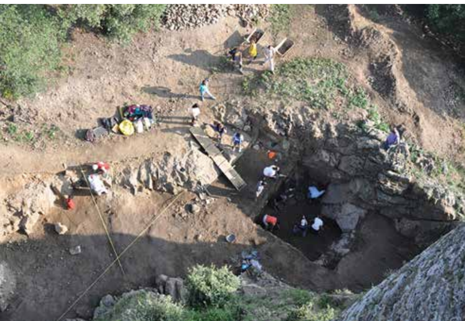
Excavació del fossat nord del castell de Montsoriu 2014.

Des de l'any 2010 es treballà en la documentació de la zona de serveis i magatzems del nord-oest del recinte. Els anys posteriors es dedicaren a l'excavació de la zona d'accés al castell: camí fortificat i barbacana i del recinte Jussà, situant la seva construcció en el segle XIV.