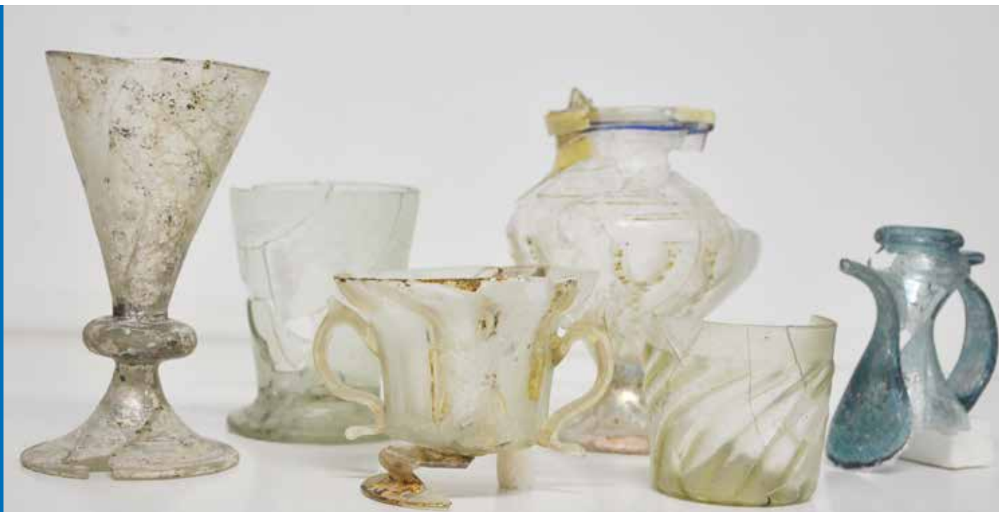
Objectes de vidre dels segles XV i XVI procedents de les intervencions arqueològiques de Montsoriu.

Es conserva a l'Arxiu Ducal Medinaceli un interessant document que ens relata l'ordre del vescomte a l'agutzil del castell per tal que buidi i marxi de Montsoriu en el termini de tres dies a causa de la presa de possessió per part del nou propietari, el marquès d'Aitona. Aquest fet històric es pot relacionar molt versemblantment amb una de les troballes arqueològiques més espectaculars duta a terme a Montsoriu 1 .