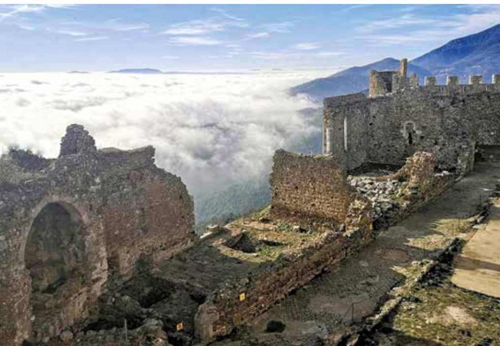
Vista parcial de l'antic palau dels vescomtes de Cabrera.

Finalment, ja en ple segle XVI, els deutes dels Enríquez de Cabrera i les contínues vendes a carta de gràcia a Francesc de Montcada, comte d'Osona i marquès d'Aitona, faran que aquest darrer s'apoderi dels territoris i títol de l'antic vescomtat de Cabrera i Bas entre els anys 1566 i 1574, pel preu de 273.000 lliures. Aquesta dinastia, Montcada-Aitona perdurarà al Vescomtat 240 anys més, fins a l'extinció de les jurisdiccions senyorials.