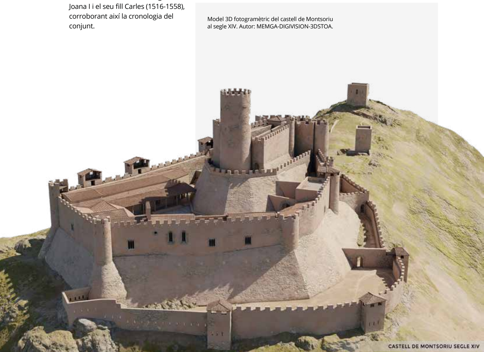
Model 3D fotogramètric del castell de Montsoriu al segle XIV. Autor: MEMGA-DIGIVISION-3DSTOA.

El procés de reconstrucció virtual en 3D ha estat molt útil també per a l'avanç de la investigació històrica – arqueològica, ja que ens permet assolir una nova visió del castell i obtenir resposta a qüestions arqueològiques.