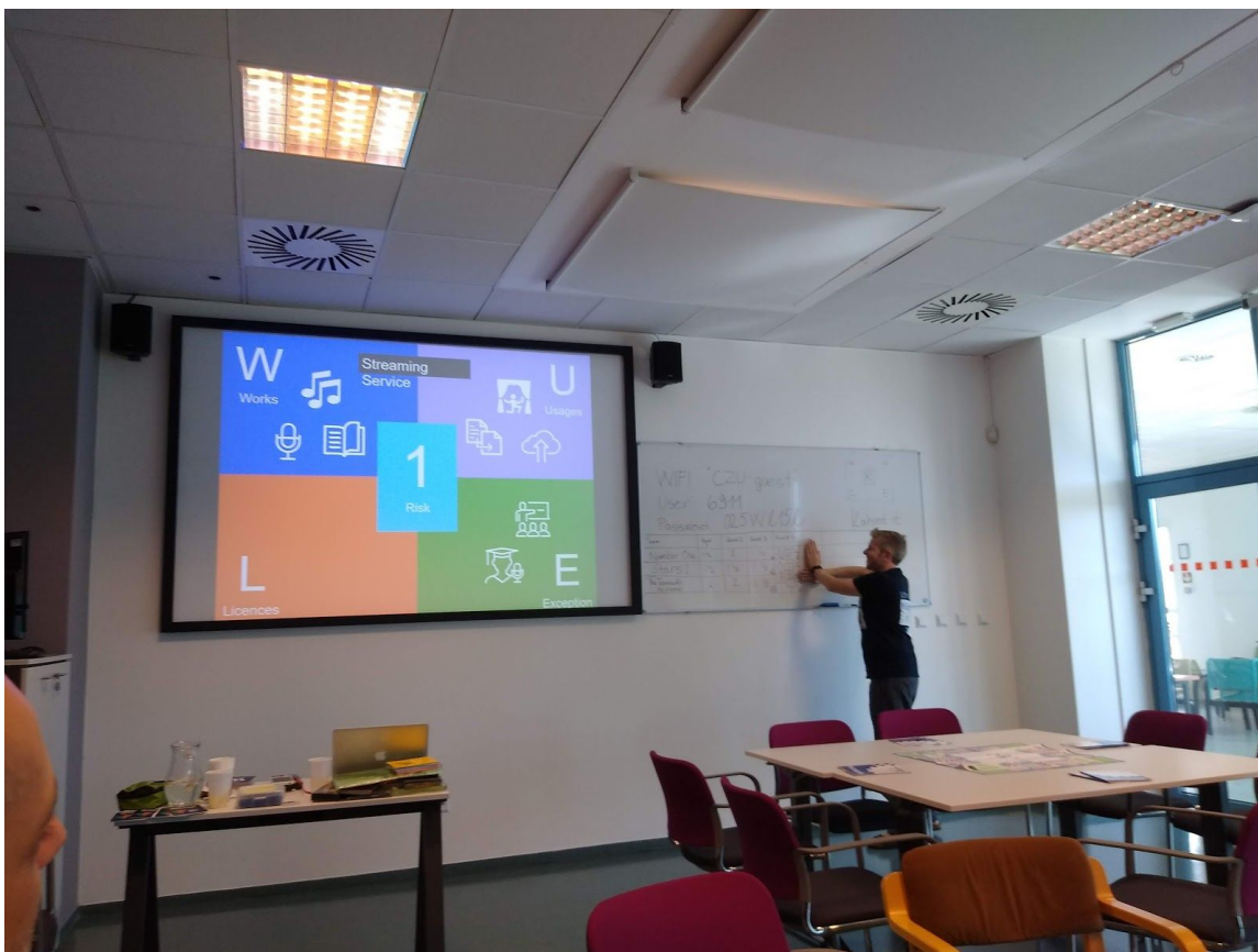
Obr. 7 - finále hry - kdopak to vyhraje? Chris drží celou všechny přítomné v napětí ...