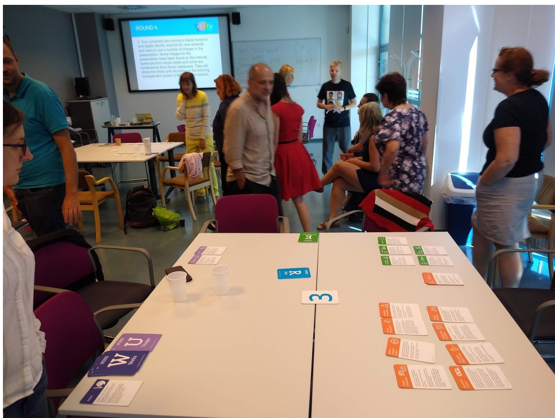
Obr. 6 - obhlížení dalších týmů a jejich odpovědí