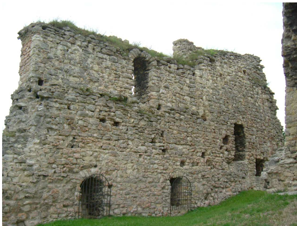
Obrázek 6: Zbytky západního paláce