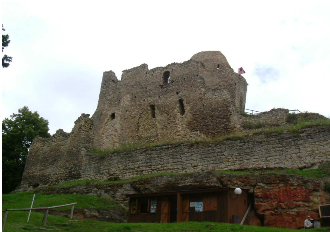
Obrázek 1: Celkový pohled na hrad od přístupové cesty

Fotografie vznikly 20. 7. 2009.