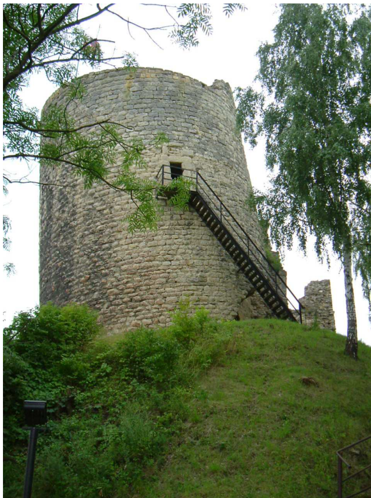
Obrázek 3: Pohled na věž, zvanou "Putna "