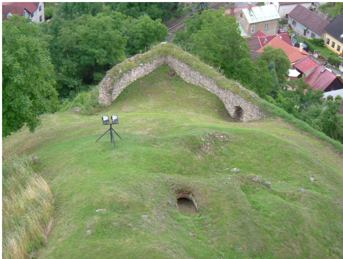
Obrázek 5: Zbytky hradeb a část podhradí