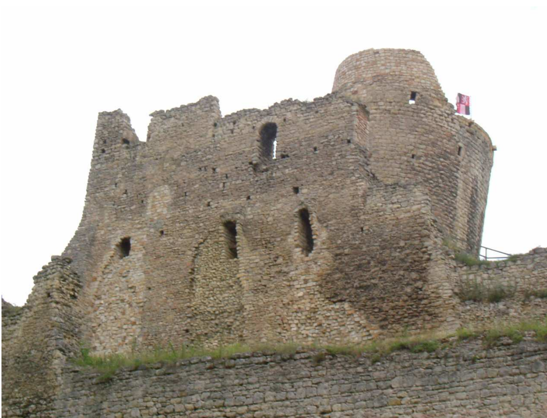
Obrázek 2: Pohled na hrad od přístupové cesty