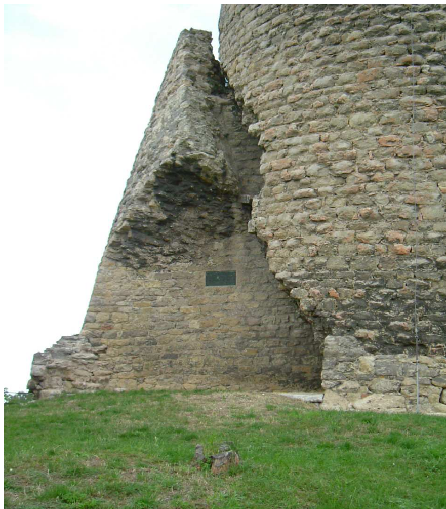
Obrázek 4 : Pamětní deska návštěvy K. H. Máchy na hradě Michalovice