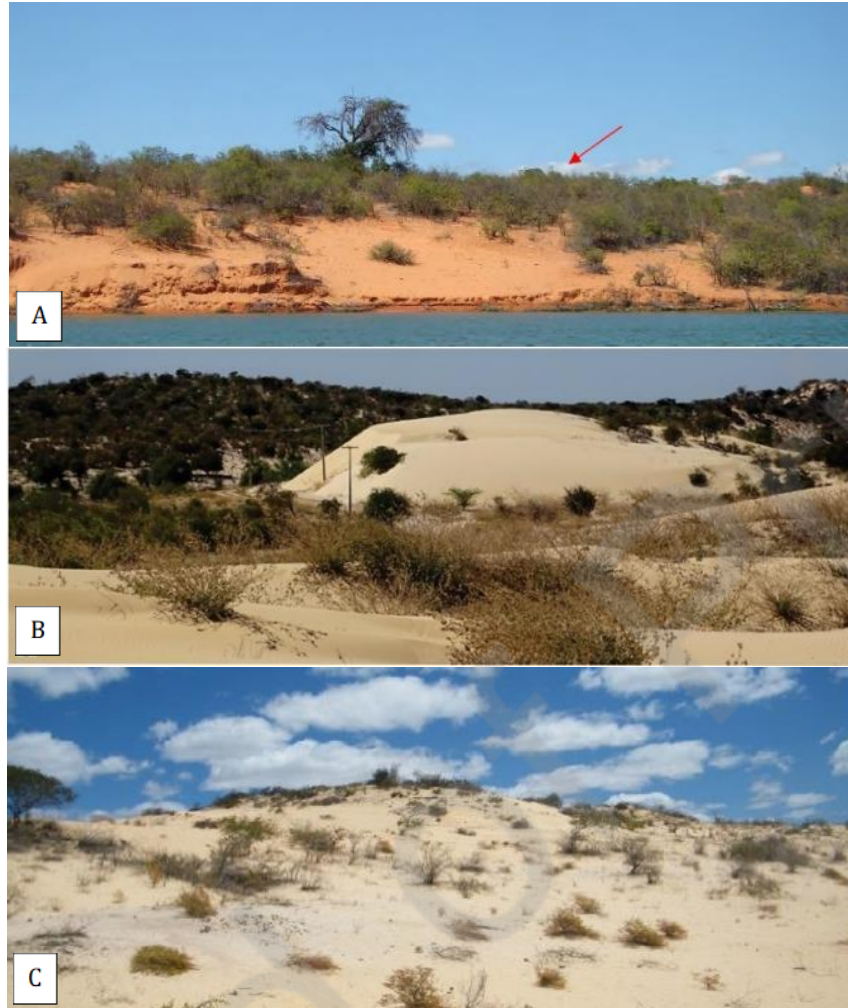
A) Dunas parabólicas dissecadas ( dissected parabolic dunes ) no município de Floresta, PE; B) Duna parabólica ativa ( active parabolic dune ) no campo de dunas de Xique-Xique, Bahia; C) Duna parabólica ( Parabolic dune ) no município de Petrolina, PE.