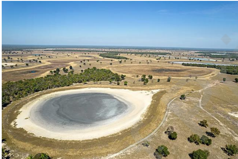
Fig. 5 – Lagoas salinas separadas por cristas baixas de dunas reliquiais na região da Nhecolândia, megaleque do Rio Taquari, município de Corumbá, MS. Figura a cores disponível online .

dessa unidade resta uma camada arenosa cuja evolução ter-se-ia dado pelo retrabalhamento eólico de um lobo abandonado do mega-leque aluvial no Holoceno inferior, sob climas áridos. Assim, embora retomem a ideia de que as depressões originais onde se instalaram as lagoas evoluíram por deflação e acúmulo de cristas arenosas, em seu entorno, pode-se afirmar que os padrões geomórficos de origem eólica do Pantanal estão entre os mais elusivos no contexto continental brasileiro, restando os elementos processuais envolvidos, em sua origem e sua cronologia absoluta ainda por serem decifrados.