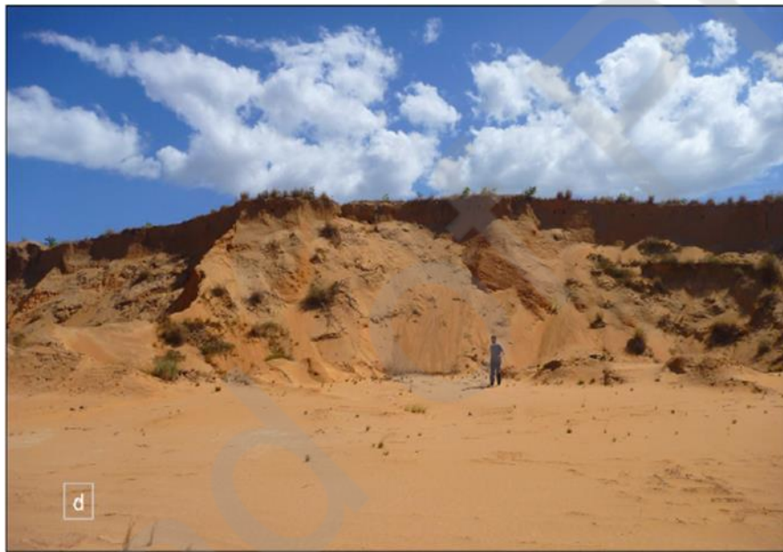
Fig. 2 – Duna ativa a oeste do Rio Branco, estado de Roraima. Figura a cores disponível online. Fig. 2 – Active dune west of the Branco River, State of Roraima. Colour figure available online.

2). Com vista a analisar especificamente as fases de atividade eólica e a estabilização das dunas, foi utilizada uma abordagem multi-proxy baseada em ensaios granulométricos, susceptibilidade magnética e reflectância dos sedimentos. Os autores identificaram três unidades deposicionais por meio da LOE e do C^{14} . A unidade basal corresponde a um depósito fluvial siltoso com idade de formação entre 53 e 28ka. Sobre essa unidade jaz discordantemente um depósito com cinco metros de espessura, formado por areias eólicas finas com idades que se estendem desde o UMG (23 a 19ka) ao evento HS1 (18,1 a 14,7ka). De acordo com os autores, esta fase seca corresponderia a um momento em que a posição média da ZCIT esteve ao sul do Equador, deixando o norte da América do Sul sob o domínio de condições anticiclônicas com ventos fortes de NE. A unidade de topo, também de origem eólica, com dois metros de espessura, é posterior ao evento HS1 (de 13,6 a 1,1ka), e foi depositada sob condições mais úmidas e com redução das áreas fonte de areia ao longo do leito do Rio Branco, devido à expansão da cobertura vegetal. A ação da pedogênese sobre esse depósito também corrobora a vigência de condições mais úmidas, estando os episódios de acumulação de areia restritos a momentos curtos (milenarios) de seca e retomada da velocidade dos ventos.