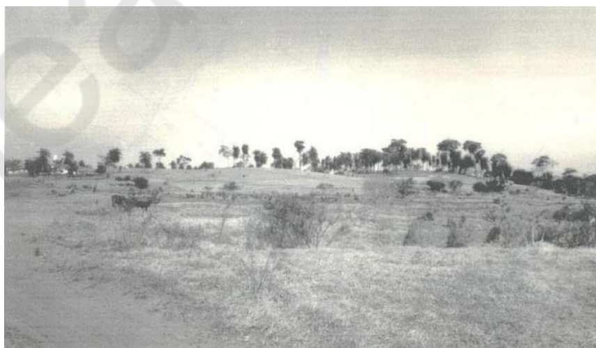
Fig. 4 – Dunas reliquiais presentes na bacia do rio Paraná, município de Taquaruçu, MS.

Os dados paleoclimáticos de Taquaruçu foram comparados com as idades obtidas em pesquisas na região de Porto Rico, também no alto curso do rio Paraná. Após analisar os dados, os autores concluíram que o período que compreende o final do Holoceno Médio até 3ka foi marcado por uma fase de semiaridez, com possível redução da cobertura vegetal na área. Em contrapartida, o período correspondente ao Holoceno Inferior parece ter sido marcado por maior umidade, com base em duas idades, 11,5±0,08ka e 9,7±0,08ka (sondagem três e dois, a profundidades de 2,2m e 2,4m, respectivamente), obtidas por meio da técnica do C^{14} em dois depósitos turfosos na planície de inundação do córrego Esperança (Parolin & Stevaux, 2002).