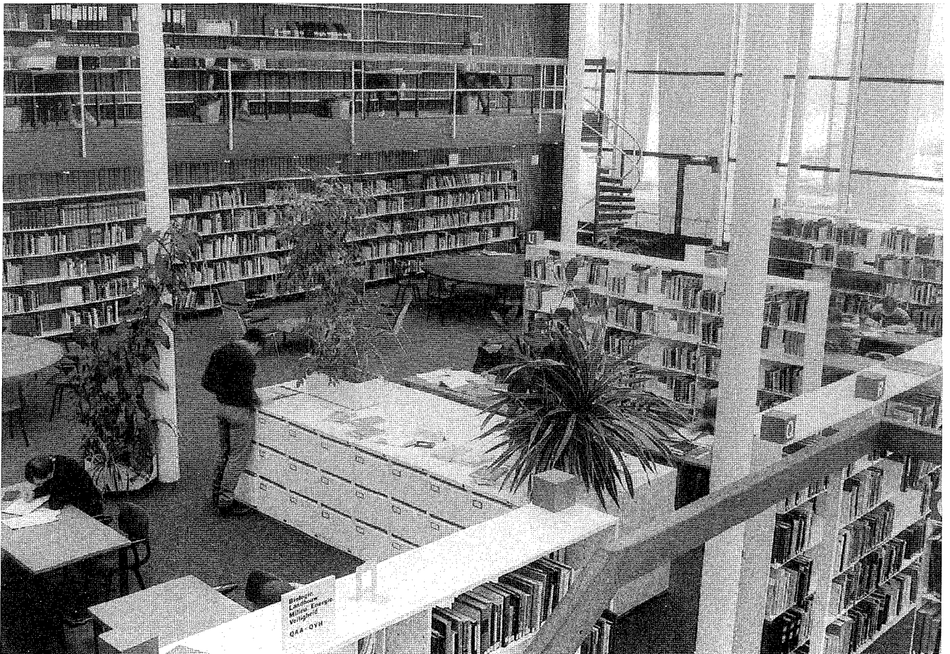
(Een deel van) de huidige centrale leeszaal in het hoofdgebouw. In de examenperiodes is het 's avonds een geliefde studieplek voor studenten, zowel van de universiteit als van de Hogeschool Eindhoven.

Het zo nu en dan optreden van verschillen van mening met (leden van) de bibliotheekcommissie is reeds even genoemd. Natuurlijk ligt dat in de opbouw-fase van een dergelijk belangrijk instituut voor onderwijs en onderzoek voor de hand. Het ontbreken van een reglement voor de bibliotheekcommissie en van een instructie voor de bibliothecaris is daar voor een belangrijk deel debet aan. Hoe dient precies de status van de bibliotheekcommissie te worden opgevat? Is het louter een adviescommissie, ligt haar werk meer in de beleidsvoorbereidende sfeer of heeft zij controlerende en/of beslissende bevoegdheden? Afhankelijk van hun achtergrond en hun visie op de taak van de centrale bibliotheek en de studiebibliotheken denken de leden van de commissie daar verschillend over. Onderhuids spelen deze competentiekwesties bij de behandeling en afdoening van belangrijke onderwerpen een rol; als voorbeeld daarvan kan men noemen de kwestie van de mechanisering respectievelijk automatisering van onderdelen van de bibliotheek en het naar buiten optreden van de bibliotheekcommissie bij landelijke bibli-