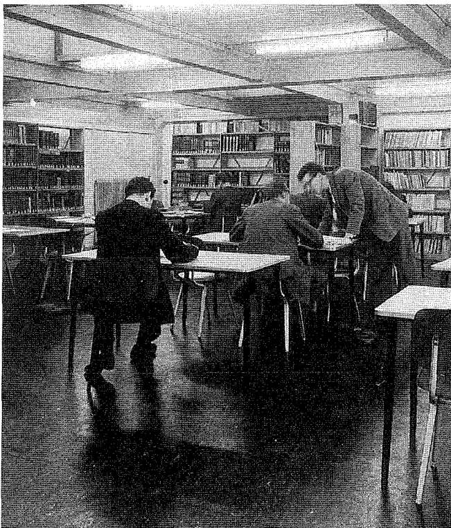
De sfeervolle centrale leeszaal van de bibliotheek in het paviljoen; de foto dateert van eind 1960.

Voorhoeve verlaat op 1 januari 1959 de bibliotheek en rept bij zijn afscheid van de "moeilijke taak van bibliothecaris". Met ingang van deze datum wordt Stellingwerff benoemd tot waarnemend bibliothecaris. In verband met zijn reeds gememoreerde benoeming aan de VU zal hij deze functie niet lang uitoefenen; het afscheid van de bibliotheek vindt plaats op 20 oktober 1960.