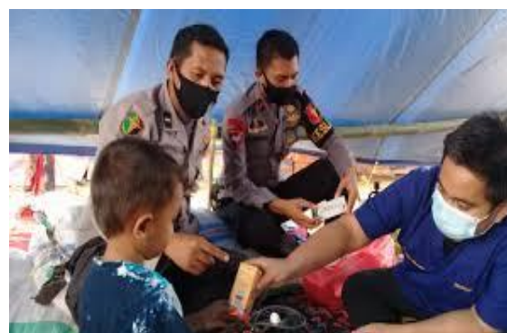
Gambar 4. Poko Kesehatan Kabupaten Luwu Utara di Area Bencana

Banyak pengungsi memiliki masalah kesehatan khususnya yang terkait dengan kesehatan air dan makanan yang dikonsumsi. Menurut data Badan Penanggulangan Bencana Daerah (BPBD) Kabupaten Luwu Utara, pada tahun 2020 ini beberapa pengungsi mengalami ISPA, diare, dermatitis dan hipertensi. Dari penyakit tersebut, penderita ISPA terbanyak sebanyak 247 orang, disusul ruam kulit 151 orang, hipertensi 137 orang dan diare 35 orang. Kemudian kelompok rentan seperti ibu hamil sebanyak 303 orang, bayi sebanyak 7 orang, anak kecil sebanyak 2223 orang dan lansia sebanyak 2623 orang. Dalam situasi bencana dan pascabencana, perempuan dan anak-anak merupakan kelompok paling rentan yang masih mendapat jaminan perlindungan. Hasil penyuluhan kesehatan yang dilakukan oleh Arham et al. , (2021) pada korban banjir di Desa Bandar Kedungmulyo, Kecamatan Bandar Kedungmulyo, Kabupaten