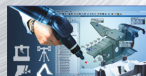
PolyWorks® Metrology Suite uno per tutti e tutti in uno! ...