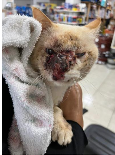
Figura 1 – Animal no dia da consulta com lesões na face de aspecto ulcerado e exsudativo.

No exame clínico foram observadas lesões ulcerativas, com sangramento e sinais de inflamação na face do animal, principalmente localizada na região nasal. Assim, foi realizado um imprint da lesão e corado com panóptico rápido, sendo observadas estruturas compatíveis com Sporothrix spp. (Figura 2).