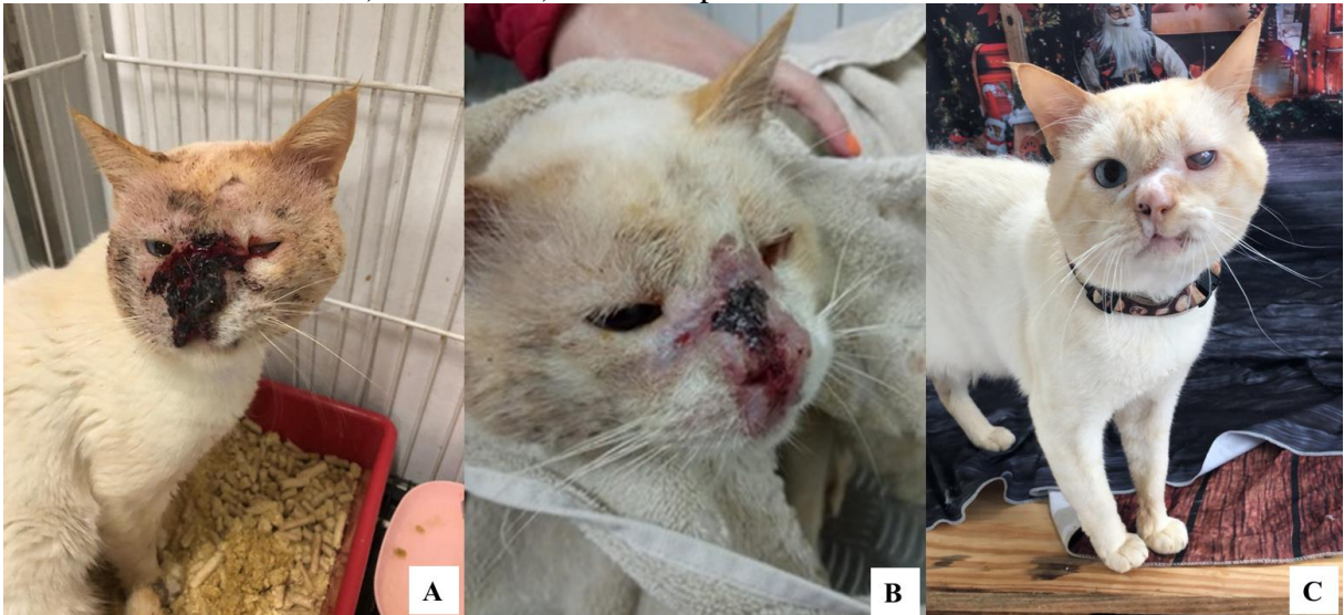
Figura 3 – Lesões na face do felino de acordo com o tempo de tratamento. A) 10 dias. B) 3 meses. C) 8 meses após o início do tratamento.

A partir do diagnóstico o tutor optou por deixar o animal internado para realização do tratamento. Assim, realizou-se a administração via oral de itraconazol (100 mg/animal), um vez ao dia (SID), durante 120 dias, antibiótico composto por amoxicilina com clavulanato de potássio (50 mg/animal), SID, durante 21 dias, e S-adenosil-metionina (90 mg/animal), SID, durante 120 dias. Observou-se boa evolução durante o período do tratamento do animal, 10 dias após (Figura 3A), 3 meses após (Figura 3B), e 8 meses após (Figura 3C). Ao encerrar o ciclo de 120 dias de tratamento o animal foi para casa, sendo prescrito por mais 30 dias itraconazol (100 mg/animal), via oral, SID, como forma de prevenção de reincidência. Após a completa cura clínica o animal foi castrado.