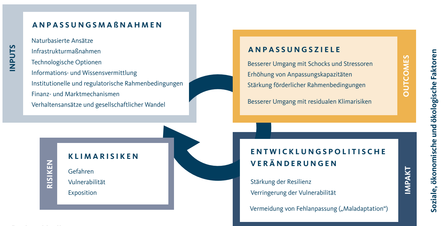
Abbildung 2 Theorie des Wandels zur Wirksamkeit von Anpassungsmaßnahmen

In der Evaluierung zeigen sich eindeutige und überwiegend positive Beiträge des deutschen Anpassungsportfolios zur Stärkung der Klimaresilienz und zur Verringerung von Vulnerabilität über die Ziele „besserer Umgang mit Schocks und Stressoren“ und „Erhöhung von Anpassungskapazitäten“ (vgl. Abbildung 2). Für das Ziel „Stärkung förderlicher Rahmenbedingungen“ bestehen aufgrund geringerer und konfligierender Evidenz hingegen Unsicherheiten