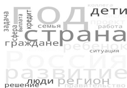
Рис. 2. Облако тегов «Послания Президента» от 2021 г.

Для 2021 года облако тегов содержит такие таксоны, как год, страна, Россия, дети, граждане, люди, решения, задача, сфера, кредит, семья, выплата, ситуация, работа, коллега, что представлено на рисунке 2.