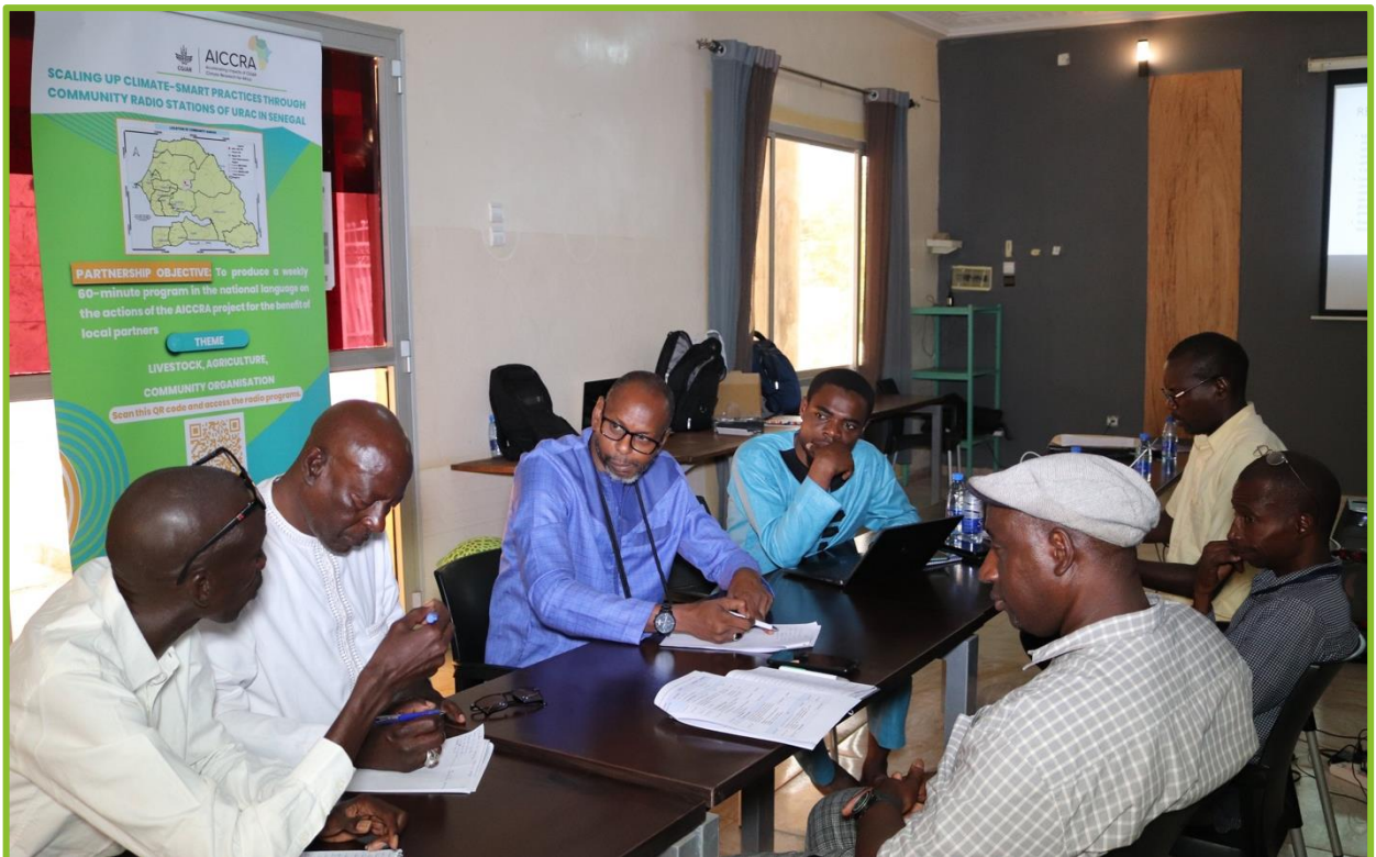
Photos d'illustration sur les sessions des groupes de travaux 1 et 2 réfléchissant sur les thématiques d'émissions 2023