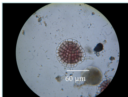
Fig. 3. Giovane tallo di Lithophyllum incrustans .

Di norma le spore delle Corallinaceae aderiscono al substrato mediante briglie mucopolisaccaridiche ed iniziano rapidamente a dividersi, secondo un piano morfogenetico caratteristico, con piani di clivaggio specie - specifici; così infatti è stato e lo si può osservare nella Fig. 3.