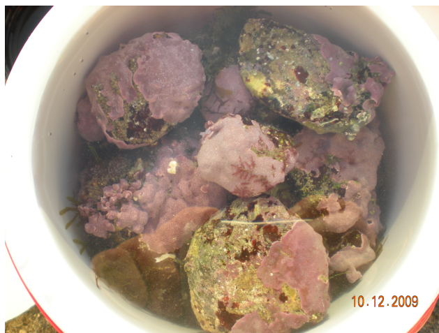
Fig. 1. Campioni di Lithophyllum incrustans utilizzati per la coltura

specie incrostante di alghe rosse calcaree (Fig. 1), venga influenzata appunto dall'acidificazione dell'acqua di mare; dall'altra di verificare l'ipotesi dell'applicabilità di metodi e strumenti propri della ricerca scientifica alla didattica nella scuola, attribuendone la connotazione di un vero e proprio “esperimento didattico”.