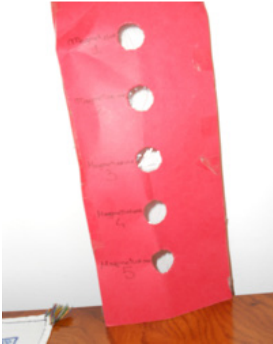
Figura 2. Il “calibro stellare” per la misura dell’intensità di una sorgente luminosa.

cinque strati di pellicola attraverso il quinto foro. Se si vedeva solo fino al quarto foro, si assegnava valore 2, e così via. Lo strumento veniva utilizzato per mostrare come i valori, per una stessa sorgente, variassero con la distanza e, inoltre, si annotavano i valori ottenuti per le due sorgenti luminose, fiammifero e lampadina, tenute alla medesima distanza.