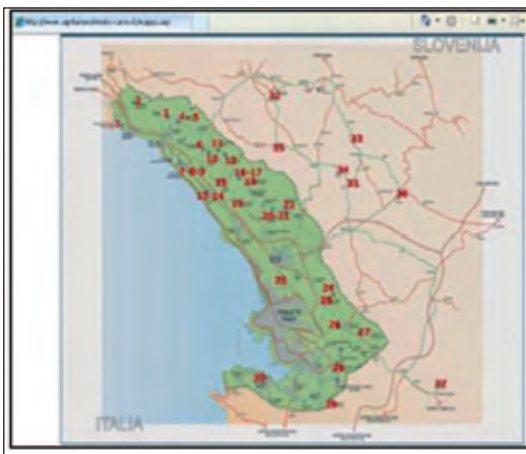
Fig. 3 - Fonte: www.agriturismotrieste-carso.it

Qui di seguito sono riportate alcune delle carte turistiche della Provincia di Trieste disponibili on-line (figg. 2-5), considerate ed analizzate sia da un punto di vista qualitativo cartografico ed iconografico sia da un punto di vista comunicativo delle risorse ambientali e culturali presenti, secondo i criteri di sostenibilità turistica (punti d'interesse, itinerari naturalistici, aree protette, prodotti locali, certificazioni ambientali, riconoscimenti di qualità, ecomusei, agriturismi, ecc.).