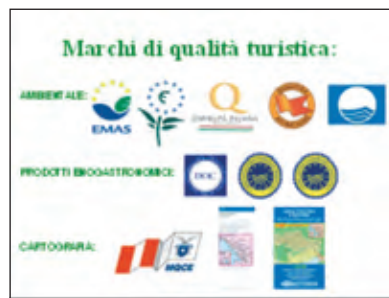
Fig. 6 - Marchi di qualità turistica

menti cartografici/topografici (scala, sistema di riferimento, orientamento, anno di produzione, legenda, simboli geometrici convenzionali, ecc.);