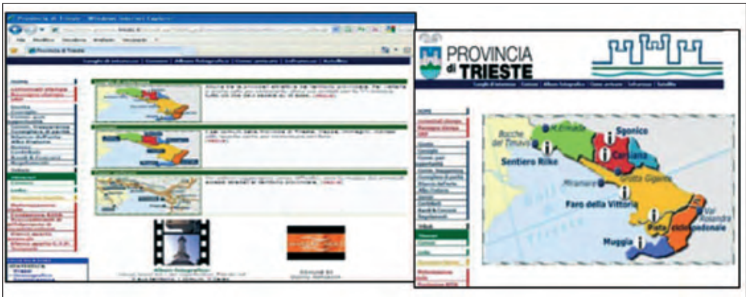
Fig. 2