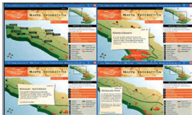
Fig. 5