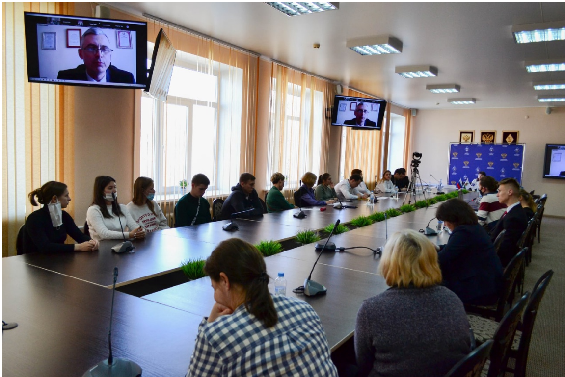
Секционное заседание в рамках конференции Panel discussion within the framework of the conference