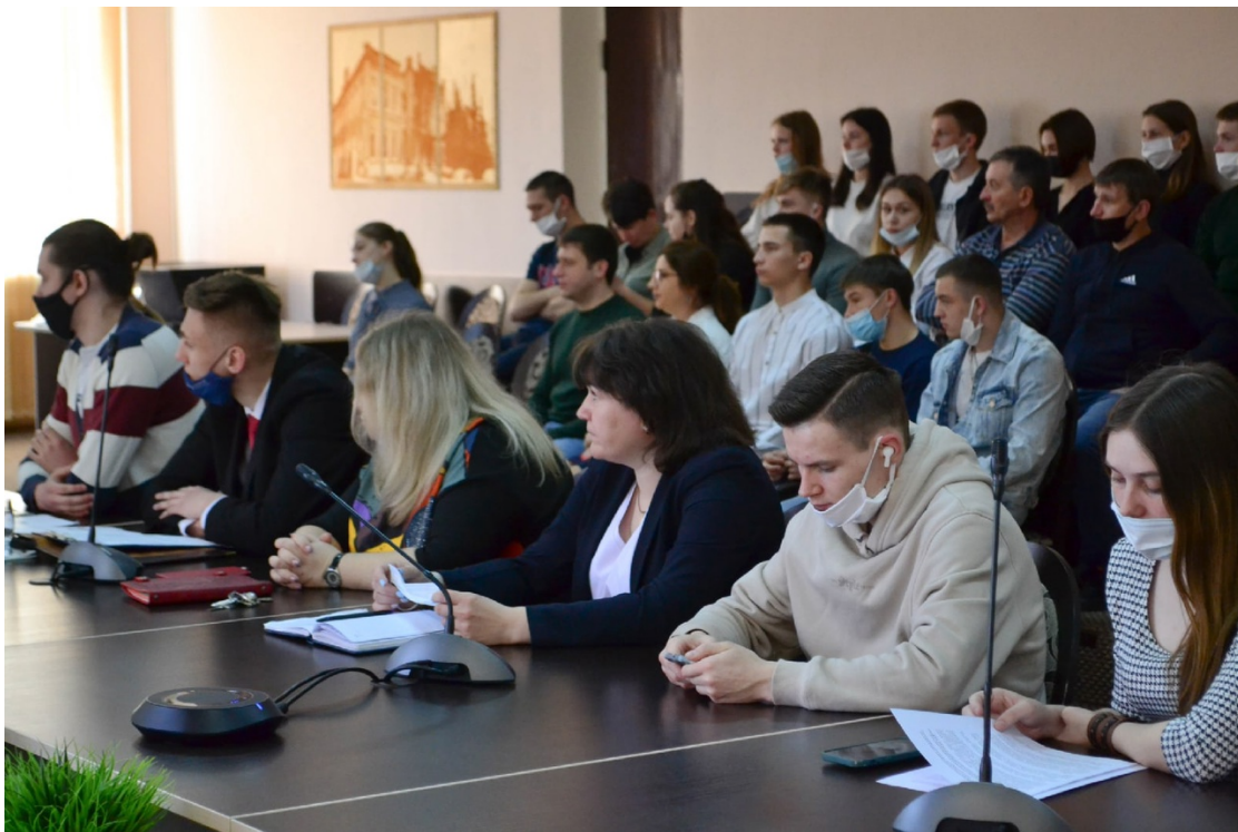
Пленарное заседание конференции Plenary session of the conference