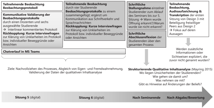
Abb. 2: Methodisches Vorgehen in Design 2 (eigene Abbildung)